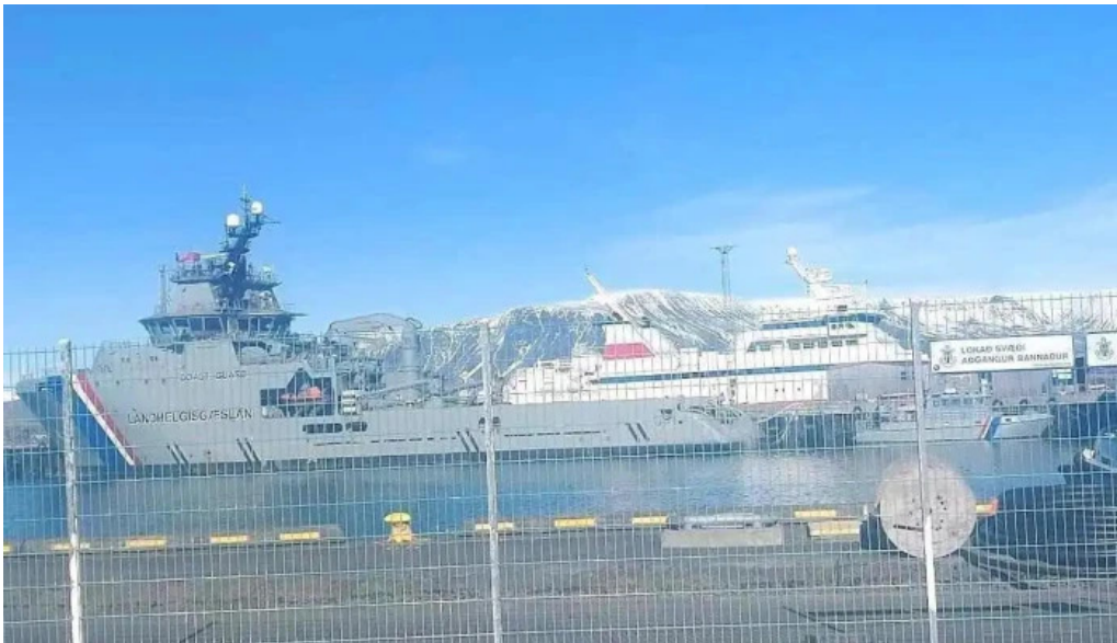
Esja gæðafæði reykjavik