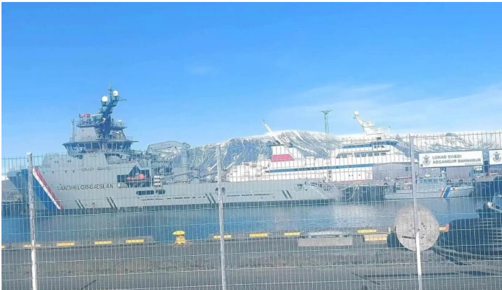
Esja gaedafaedi skrifstofa fyrirtækis