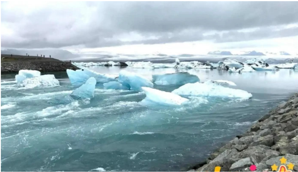
Sveitarfélagið skagafjörður sauðarkrokur