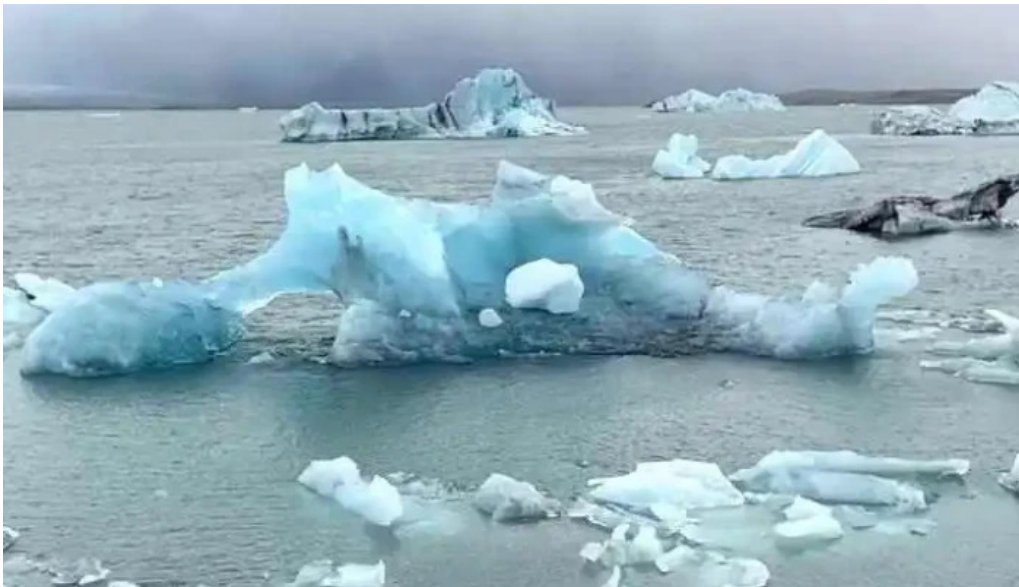
Sveitarfélagið skagafjörður myndskemd