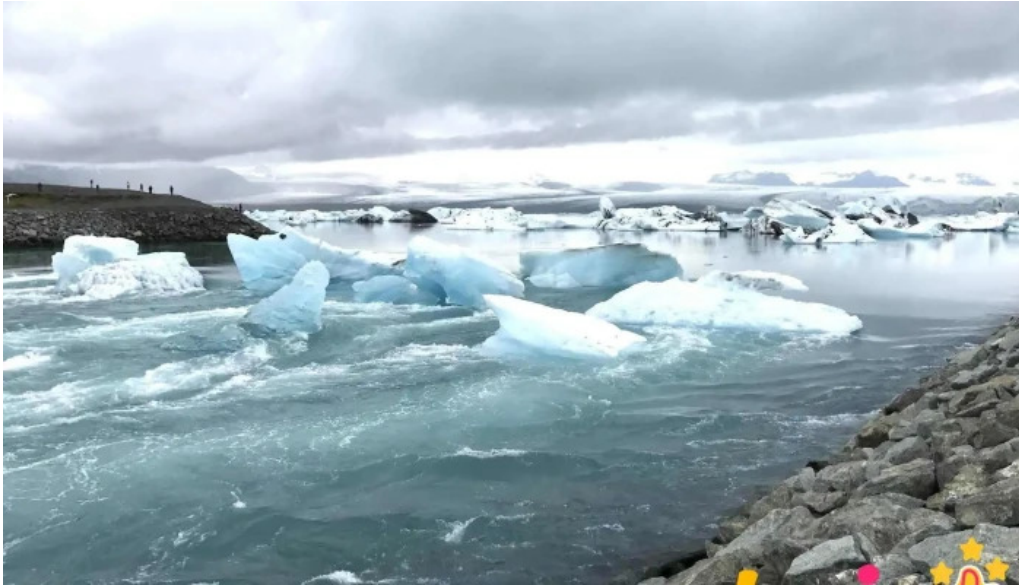
Sveitarfélagið skagafjörður skrifstofa borgarstjórnar