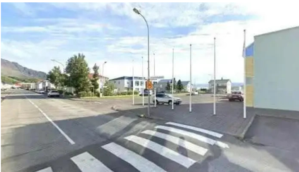
Sveitarfélagið skagafjörður street view 360deg