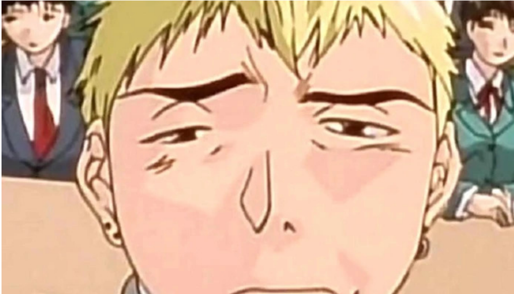
Grunnskoli snaefellsbaejar olafsvik