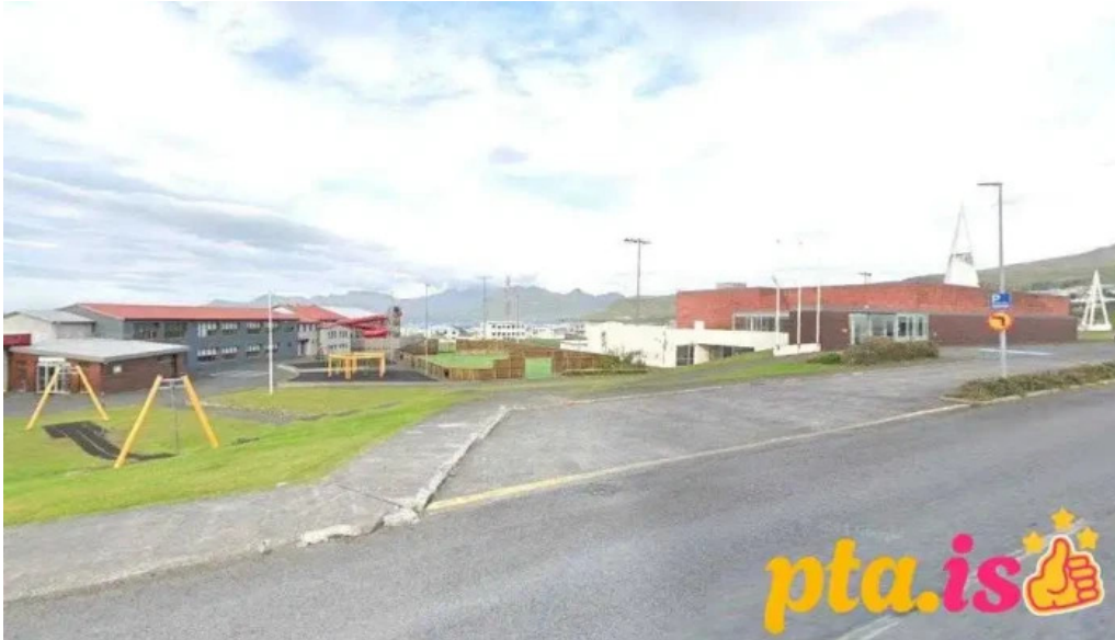
Grunnskoli snæfellsbæjar olafsvik