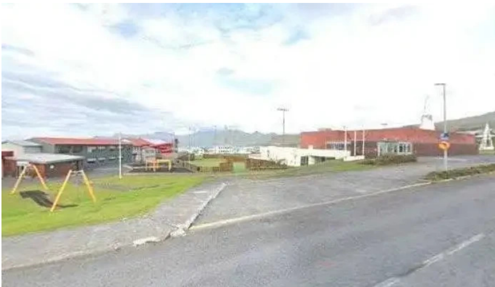
Grunnskoli snæfellsbæjar skoli