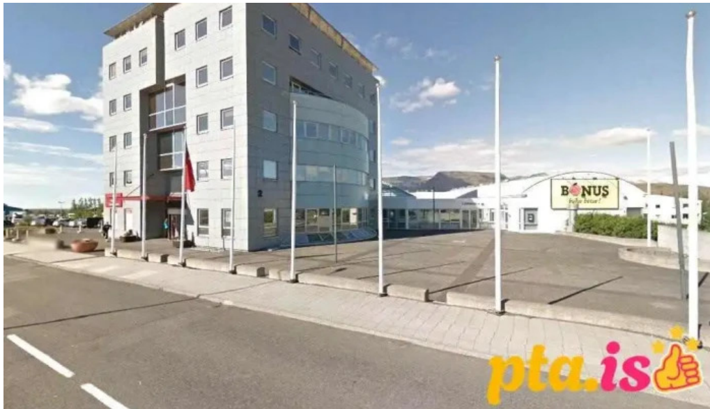
Listaskoli mosfellsbæjar mosfellsbær