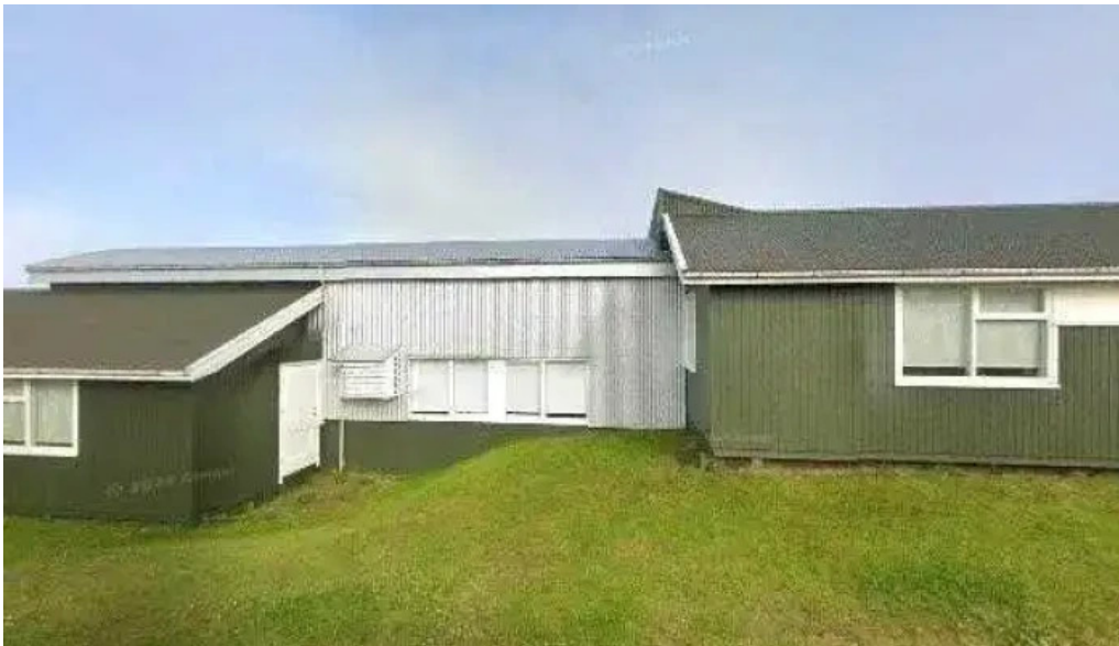
Grunnskoli borgarfjardar street view 360deg