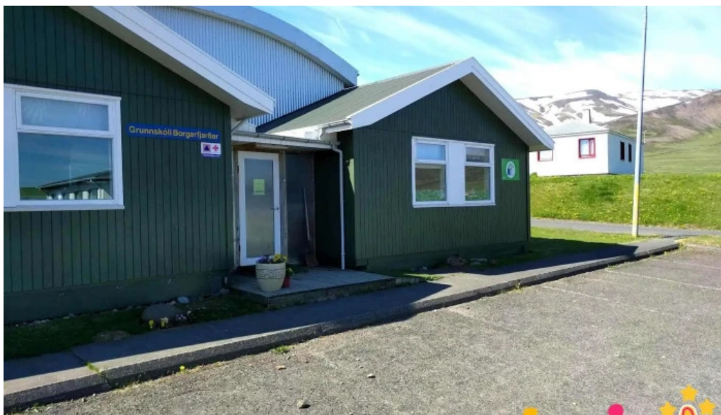
Grunnskoli borgarfjardar skoli