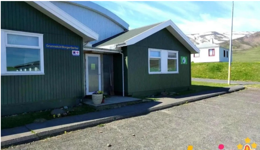
Grunnskoli borgarfjarðar borgarfjorður eystri