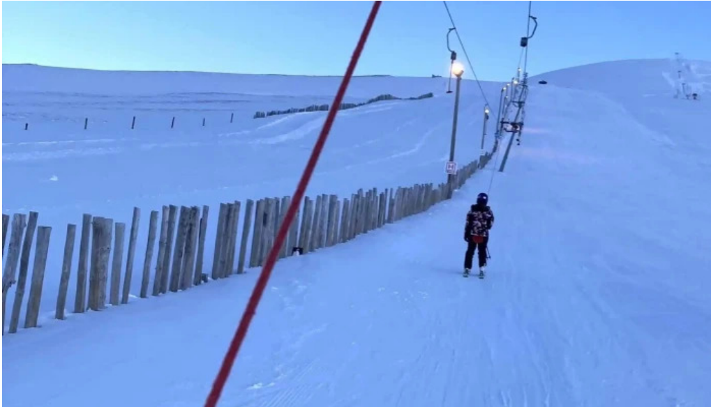
Skidasvaedid i tindastol opið nuna