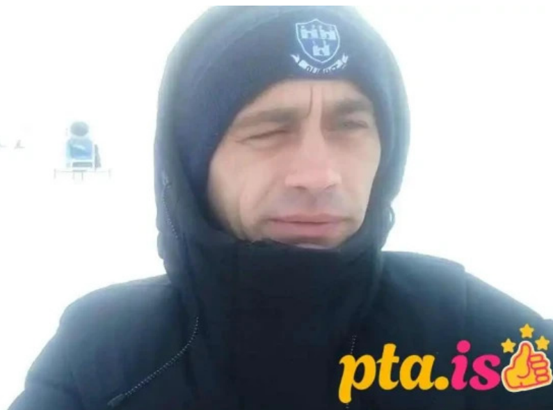
Skidasvaedid i tindastol myndskleid