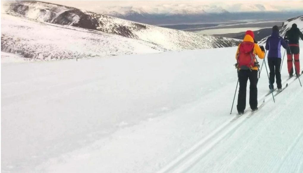
Skidasvaedid i tindastol staðsetning