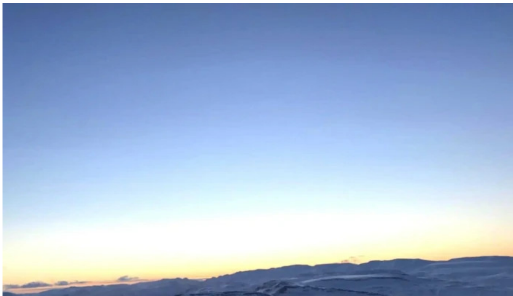
Skidasvaedid i tindastol instagram