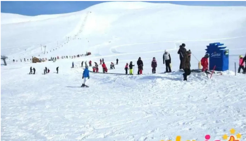
Skidasvaedid i tindastol skiðadvalarstaður