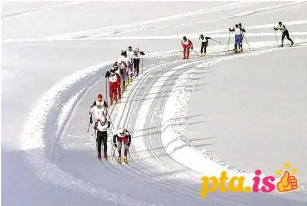
Skidasvaedid i tindastol fra eiganda