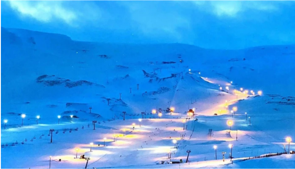
Skidasvaedid i tindastol hvar