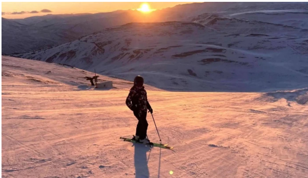
Skidasvaedid i tindastol sauðarkrokur