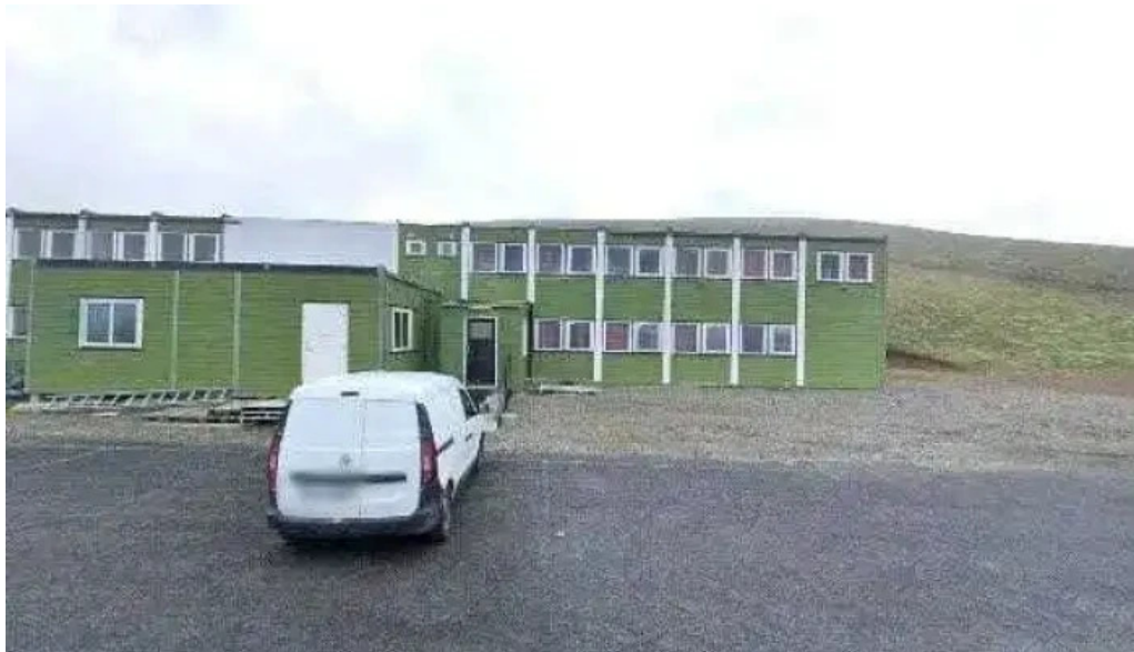
Skidasvaedid i tindastol street view 360deg