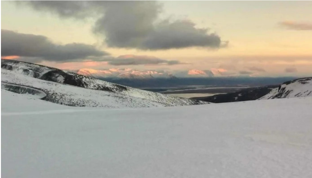
Skidasvaedid i tindastol einkunn