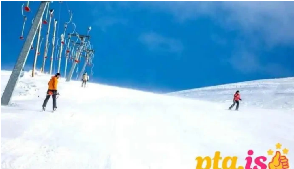
Skidasvaedid i tindastol skidi