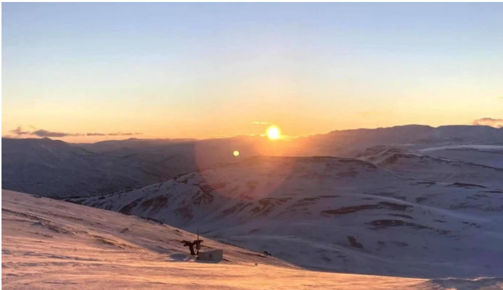
Skidasvaedid i tindastol nalægt mer