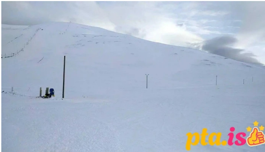
Skidasvaedid i tindastol vetur