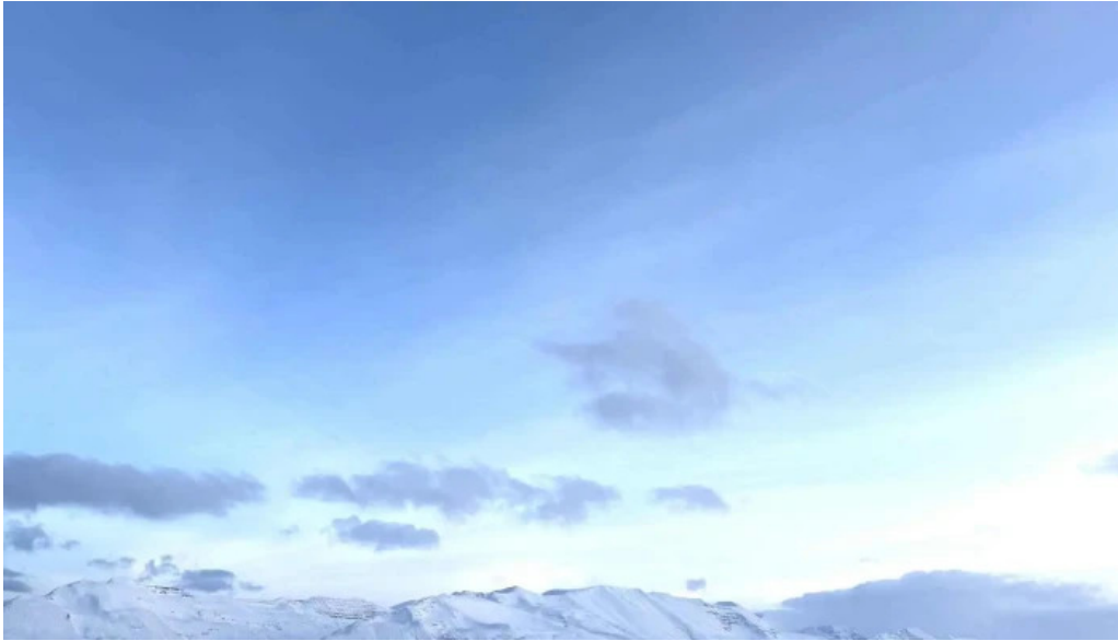
Skidasvaedi dalvikur myndir