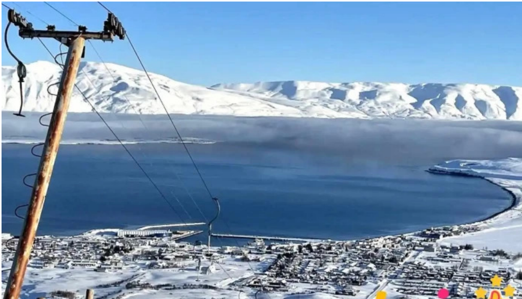
Skíðasvæði dalvíkur dalvík