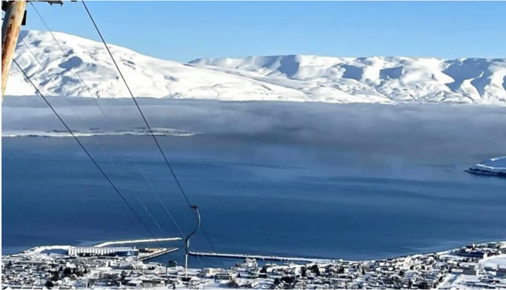
Skidasvaedi dalvikur umsagnir