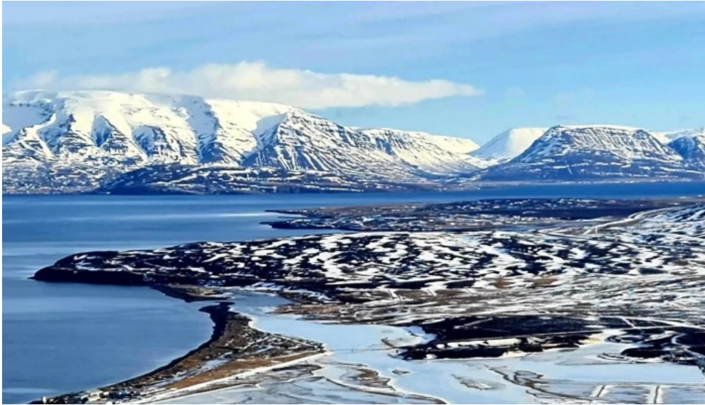
Skidasvaedi dalvikur athugasemdir