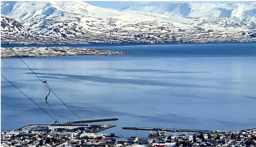
Skidasvaedi dalvikur instagram