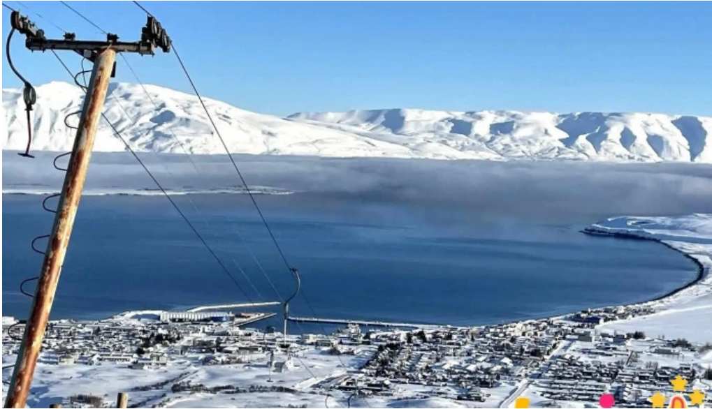
Skidasvaedi dalvikur skiðadvalarstaður