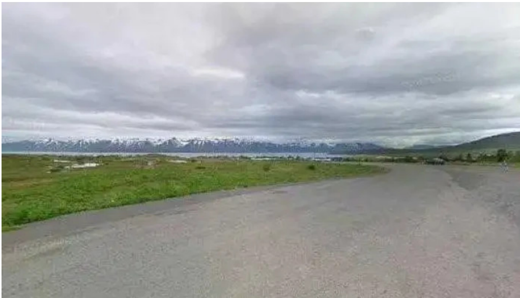
Skidasvaedi dalvikur street view 360deg