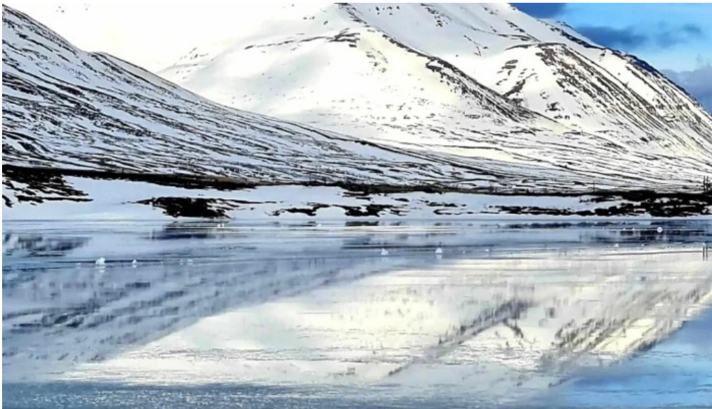
Skidasvaedi dalvikur dalvik