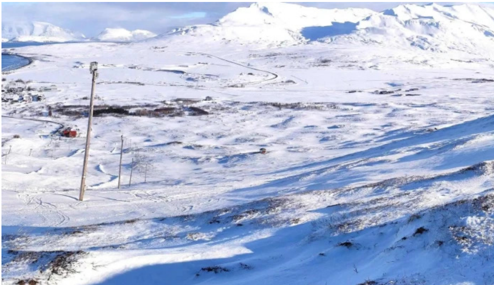
Skidasvaedi dalvikur opið nuna