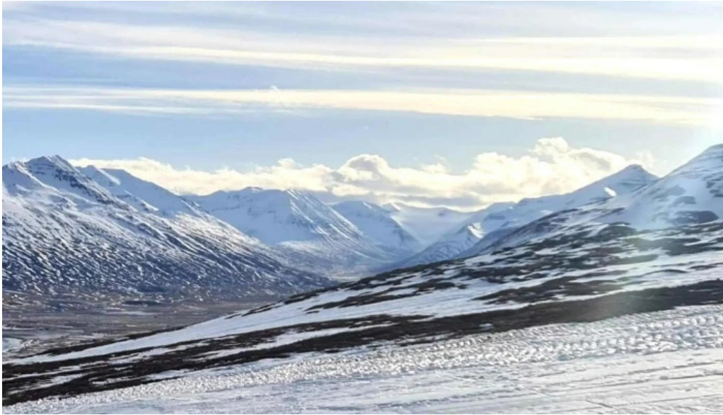
Skidasvaedi dalvikur hvernig a að komast þangað