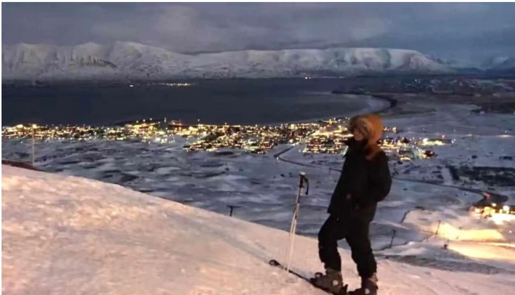
Skidasvaedi dalvikur verð