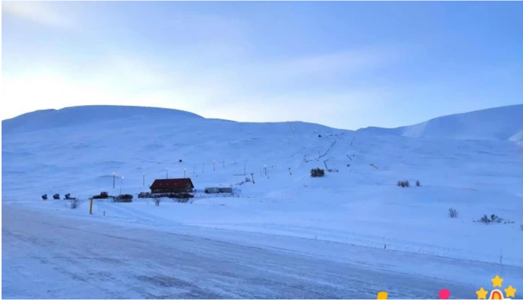
Skidasvaedi dalvikur vetur