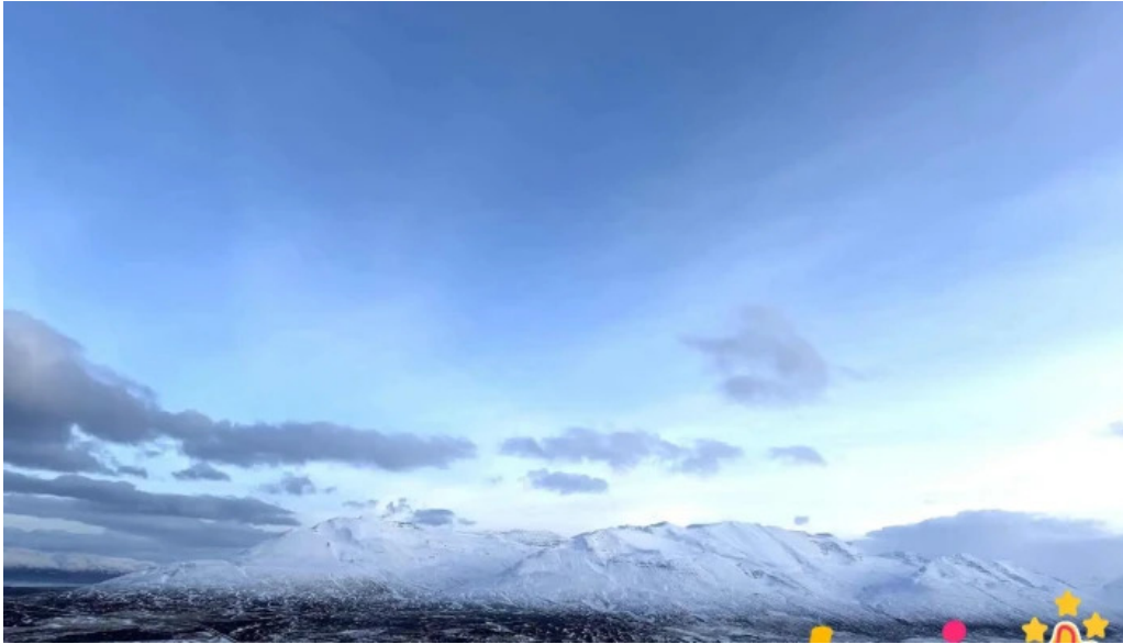
Skidasvaedi dalvikur nyjast