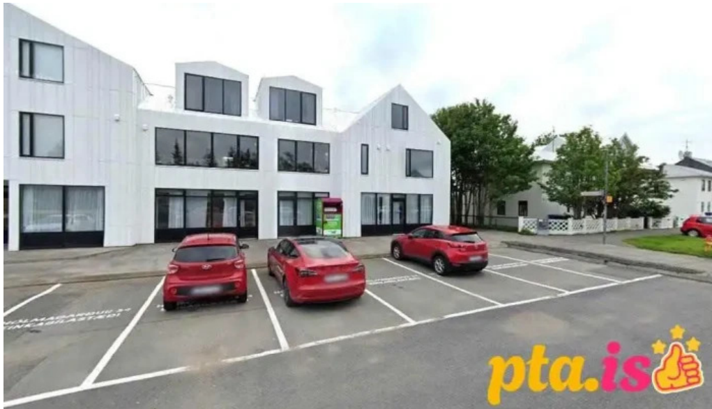
Skatafelagið garðbuar reykjavík