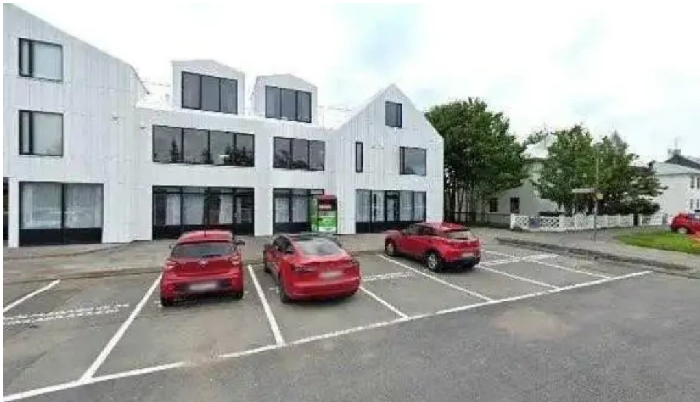
Skatafelagið garðbuar skataheimili