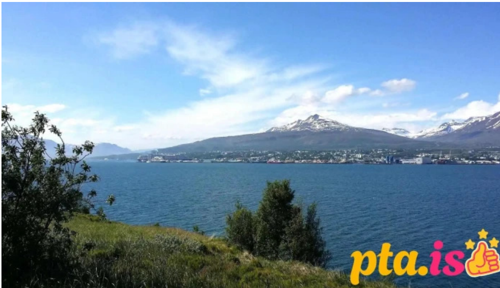
Solheimar 9 svalbardsstrond fra gestum