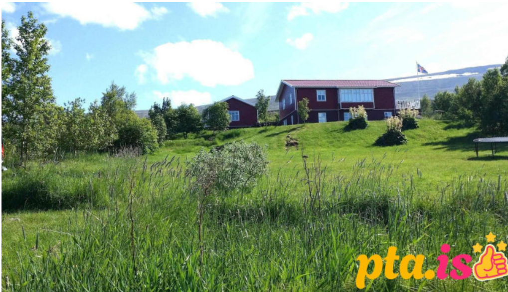
Solheimar 9 svalbardsstrond skali