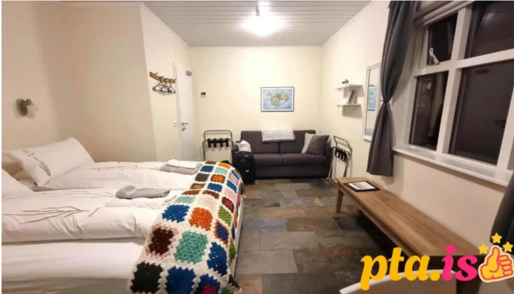
Solheimar 9 svalbardsstrond herbergi