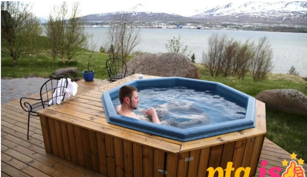
Solheimar 9 svalbardsstrond thjonusta