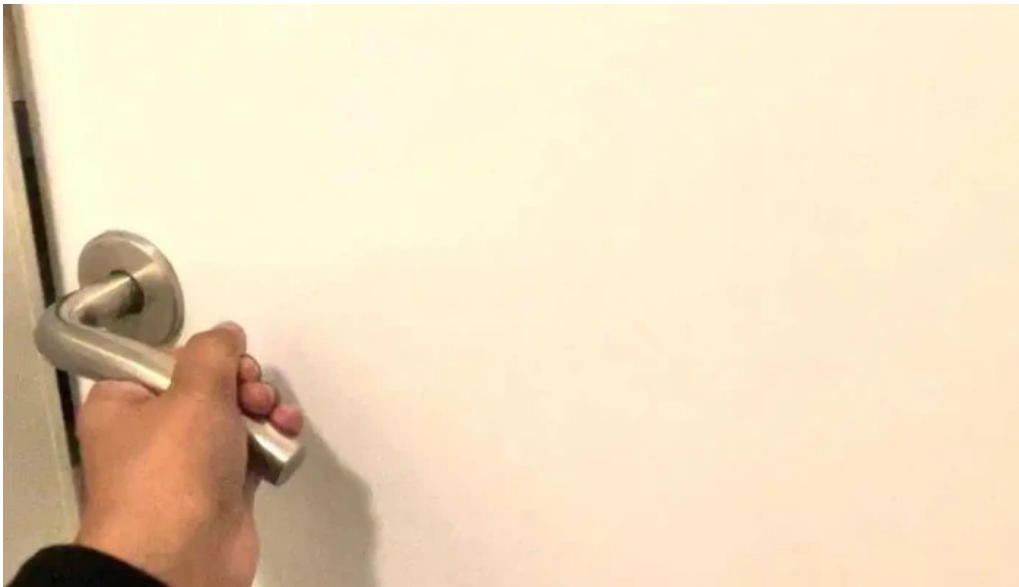
Solheimar 9 svalbardsstrond myndskaid