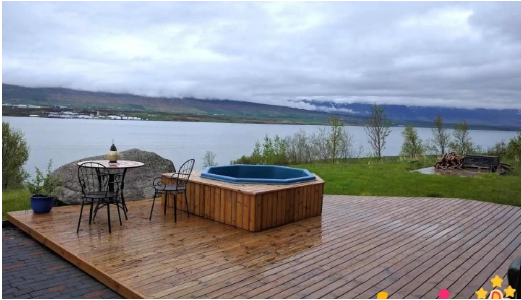
Solheimar 9 svalbardsstrond naerumhverfi