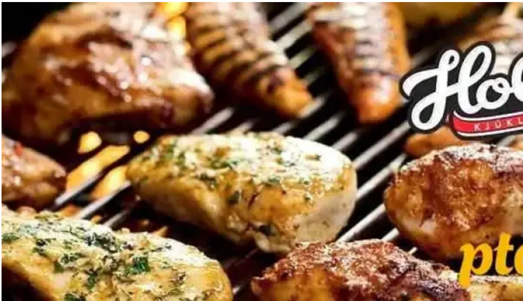
Reykjagardur holta kjuklingur sjoflutningar