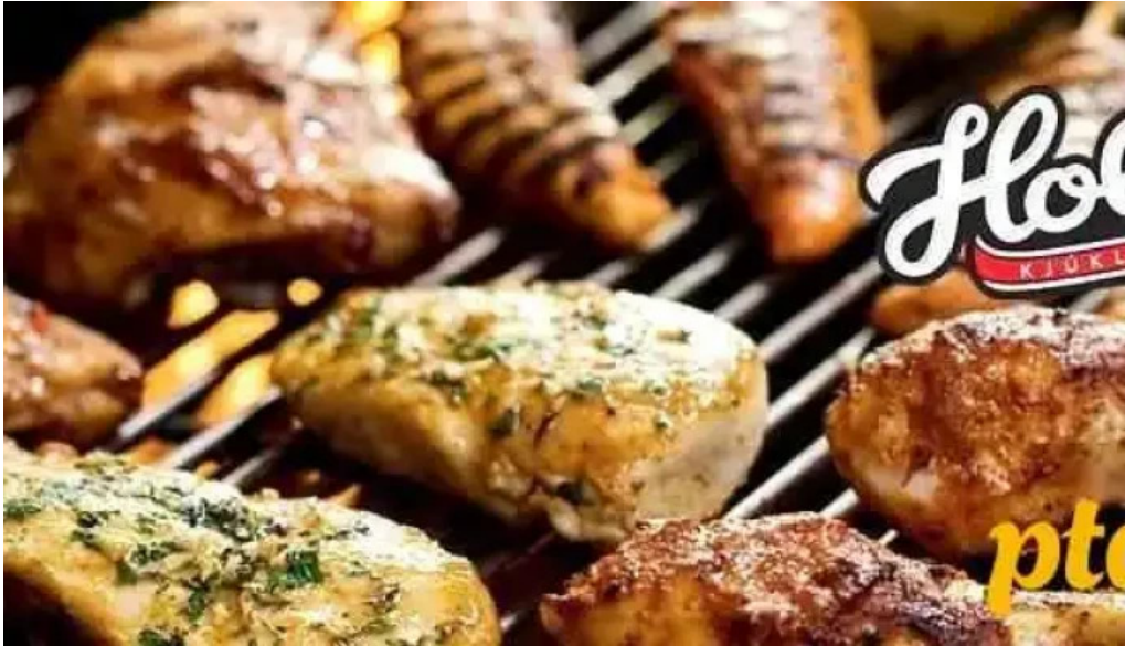
Reykjagarður holta kjuklingur reykjavík