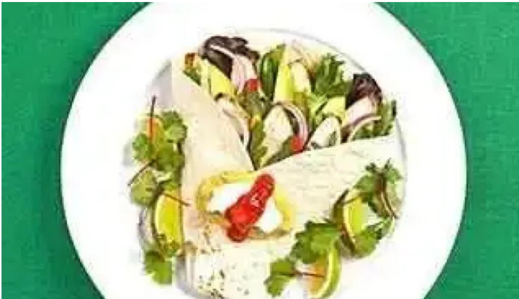
Reykjagardur holta kjuklingur fra eiganda