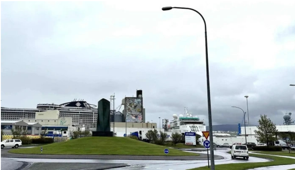
Korngardur cruise terminal reykjavik