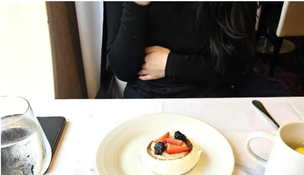
Korngardur cruise terminal hvernig a að komast þangað