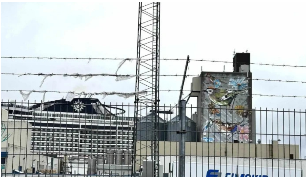
Korngardur cruise terminal umsagnir