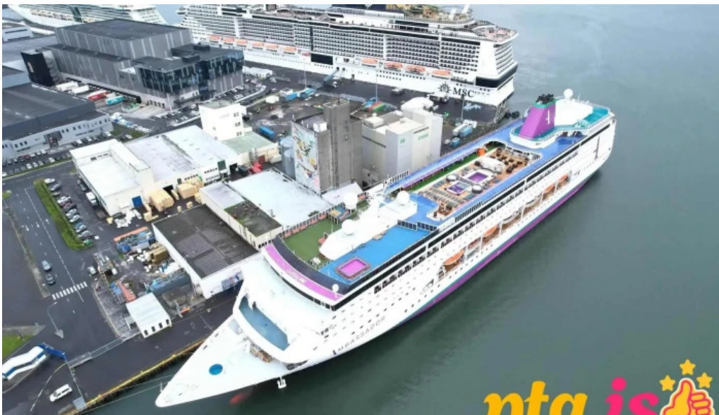
Korngardur cruise terminal sjoflutningar