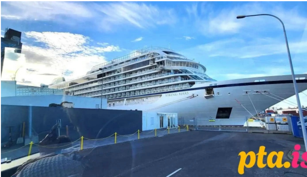
Korngardur cruise terminal hofn