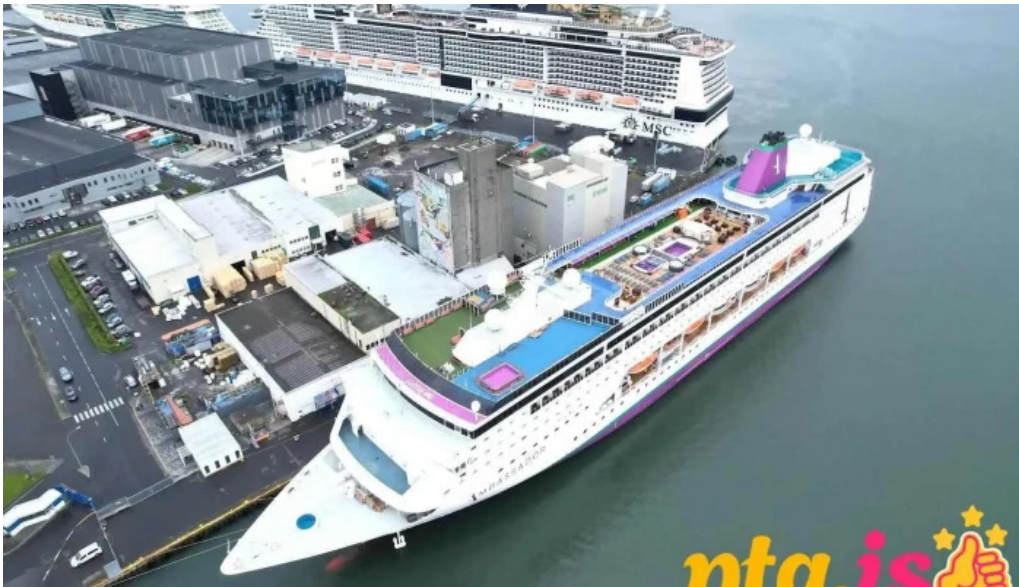
Korngarður cruise terminal reykjavik