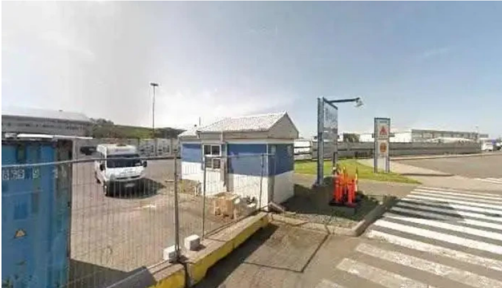
Korngardur cruise terminal street view 360deg