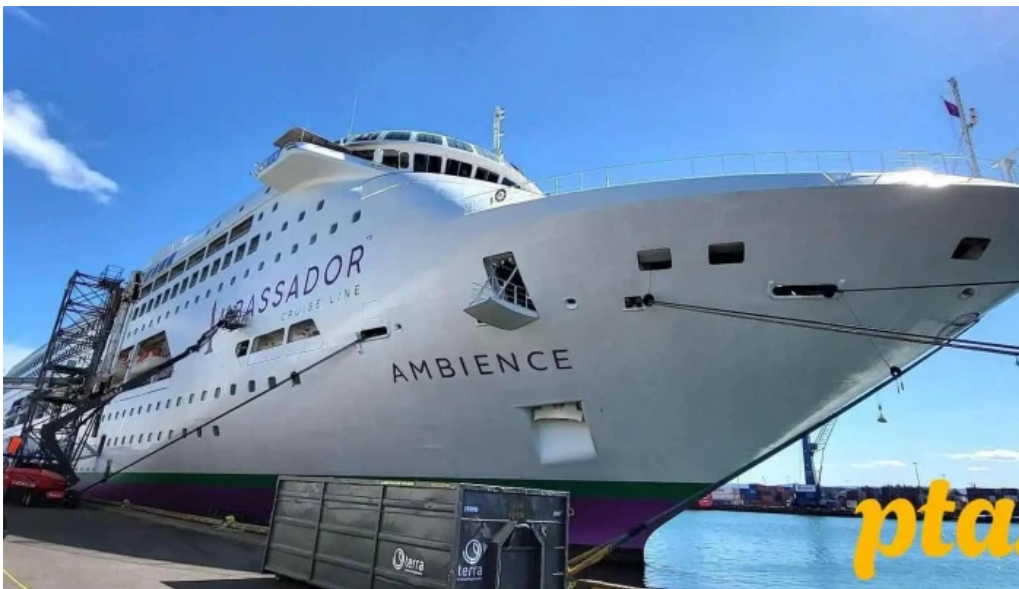
Korngardur cruise terminal batur