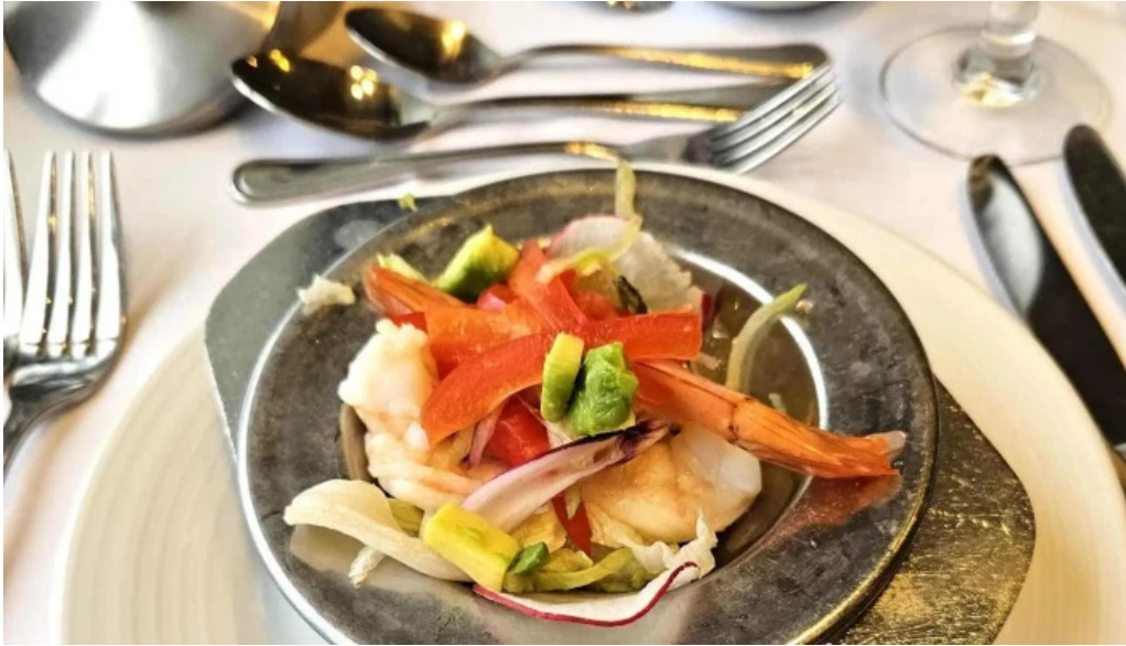
Korngardur cruise terminal simi