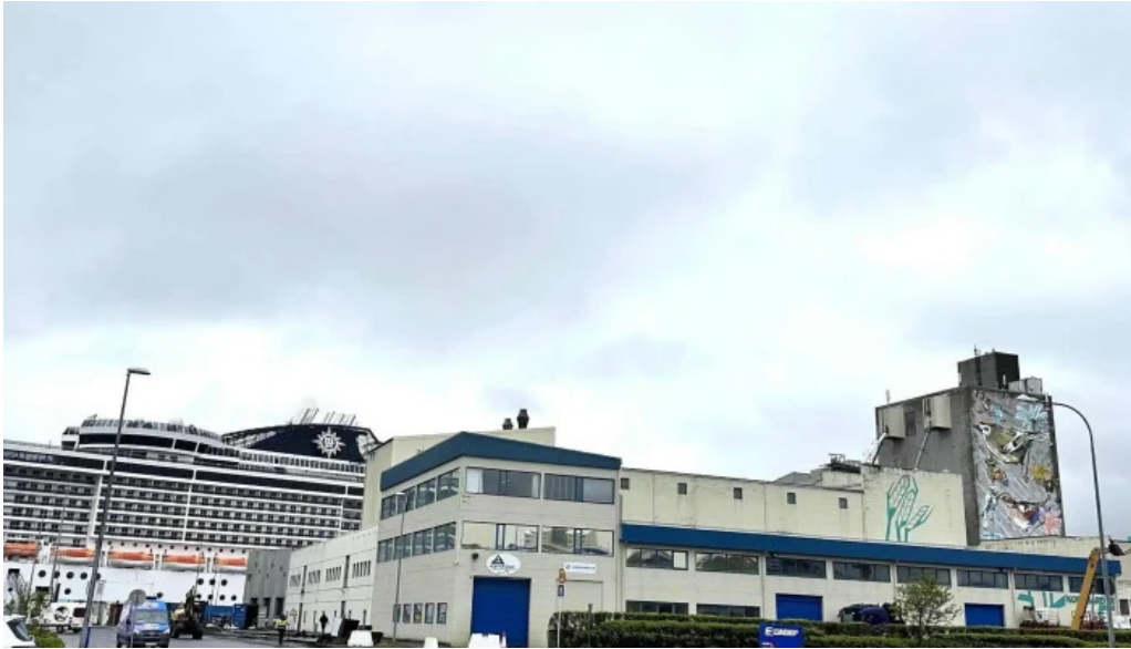
Korngardur cruise terminal nálægt mer