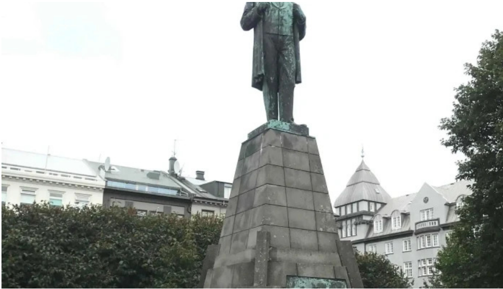
Jon sigurdsson umsagnir