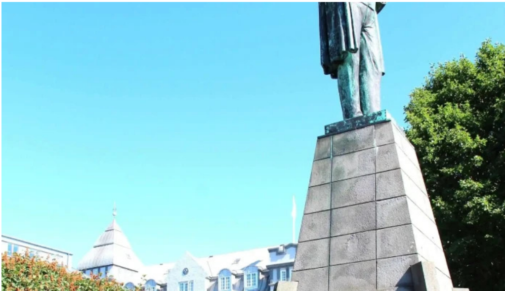
Jon sigurdsson vefsíða