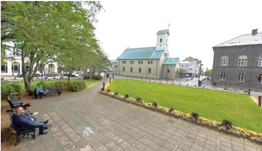
Jon sigurdsson street view 360deg