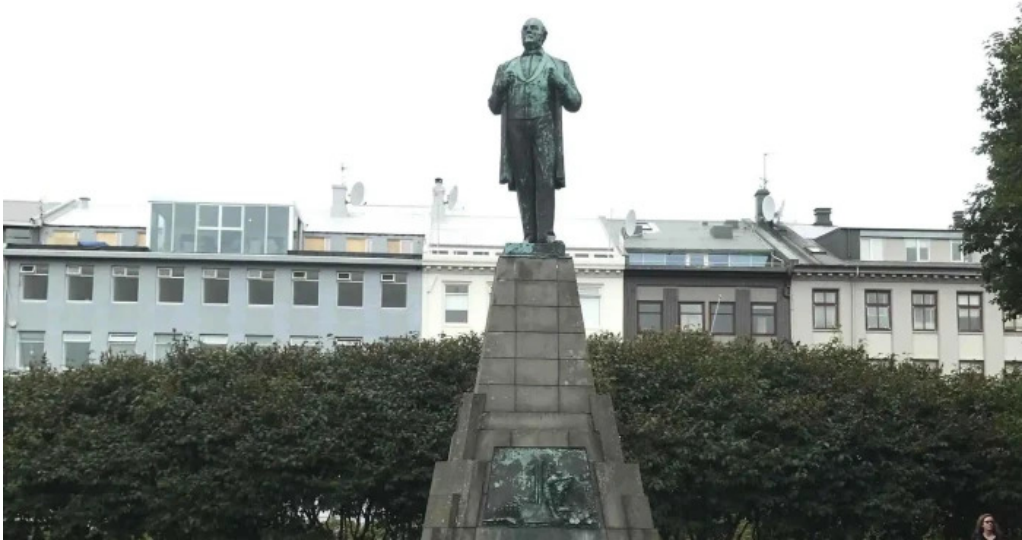
Jon sigurdsson safn