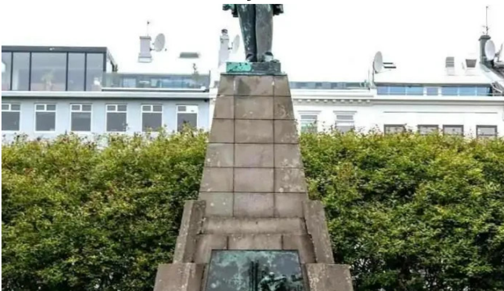
Jon sigurðsson reykjavik