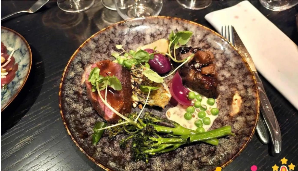
Fiskfelagid matur og drykkur