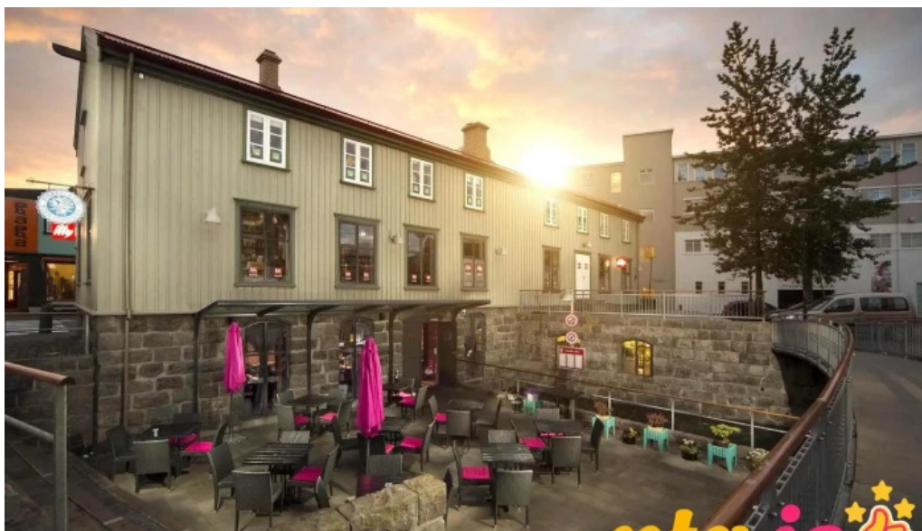
Fiskfelagid fra eiganda