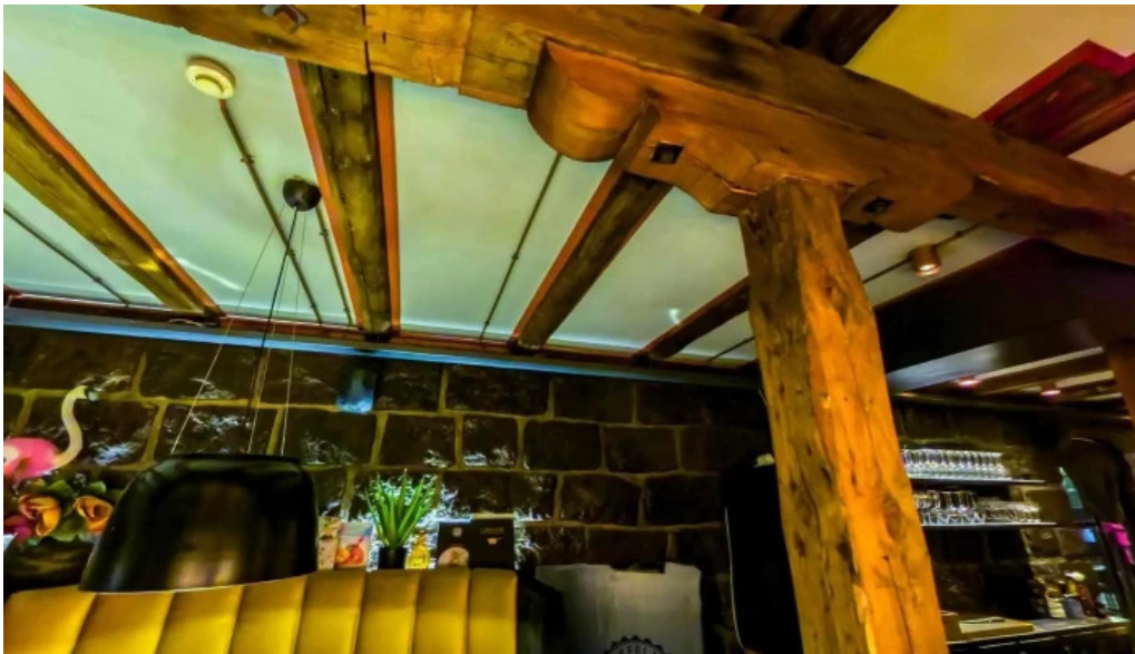
Fiskfelagid street view 360