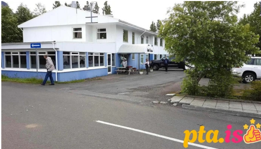
Vegagerdin samtök verkfræðinga a sviði vega hafna og skipaskurða