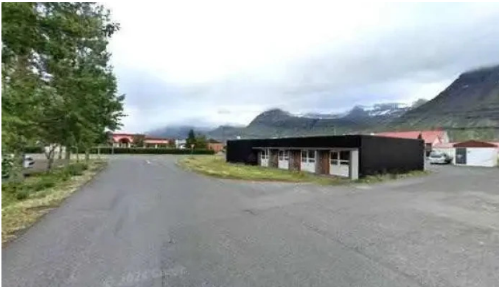
Vegagerdin street view 360deg