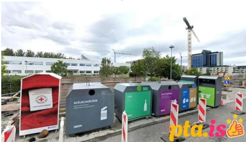
Felag sameinuðu þjodanna a islandi reykjavik