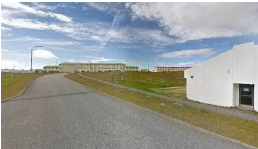
Reykjanes jarðvangur samtök sem ekki eru rekin í hagnaðarskygni