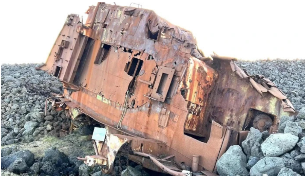
Hopsnes lighthouse numer