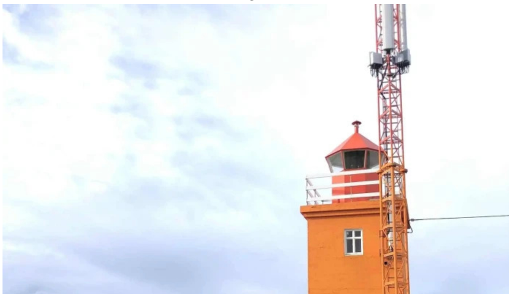
Hopsnes lighthouse umsagnir