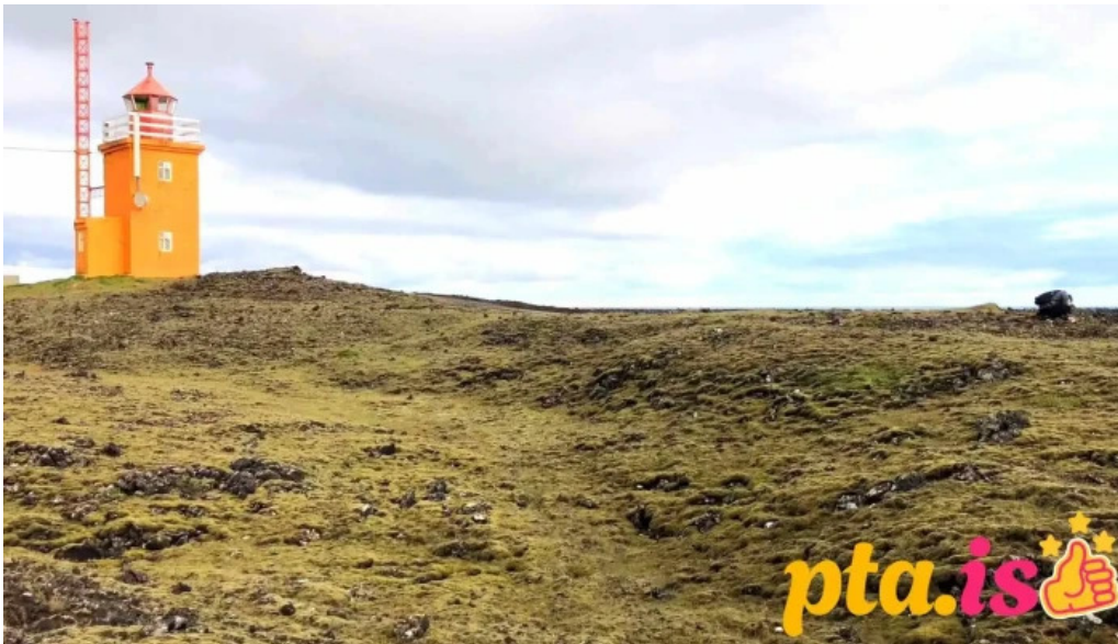
Hopsnes lighthouse myndskid