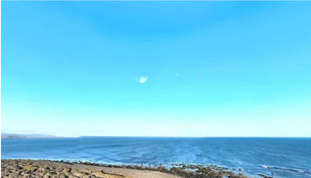
Hopsnes lighthouse street view 360deg