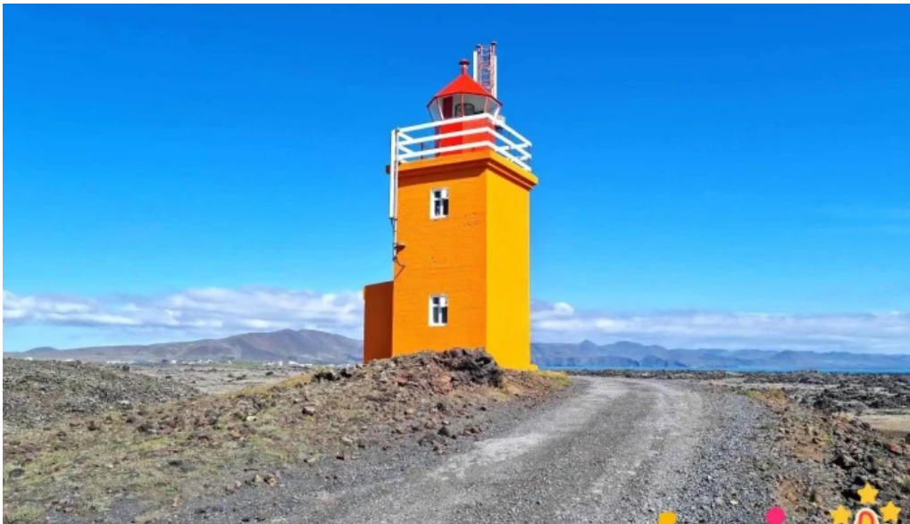
Hopsnes lighthouse samtök sem ekki eru rekin i hagnaðarskyni