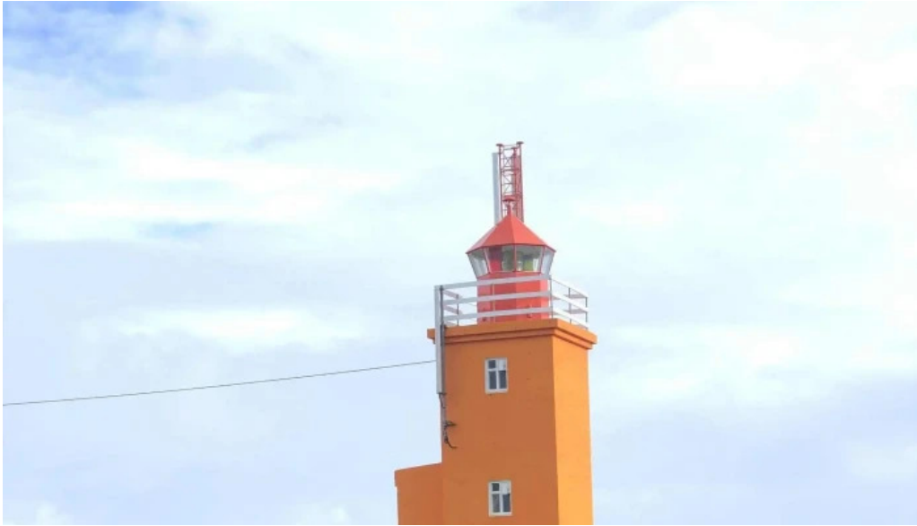
Hopsnes lighthouse einkunn