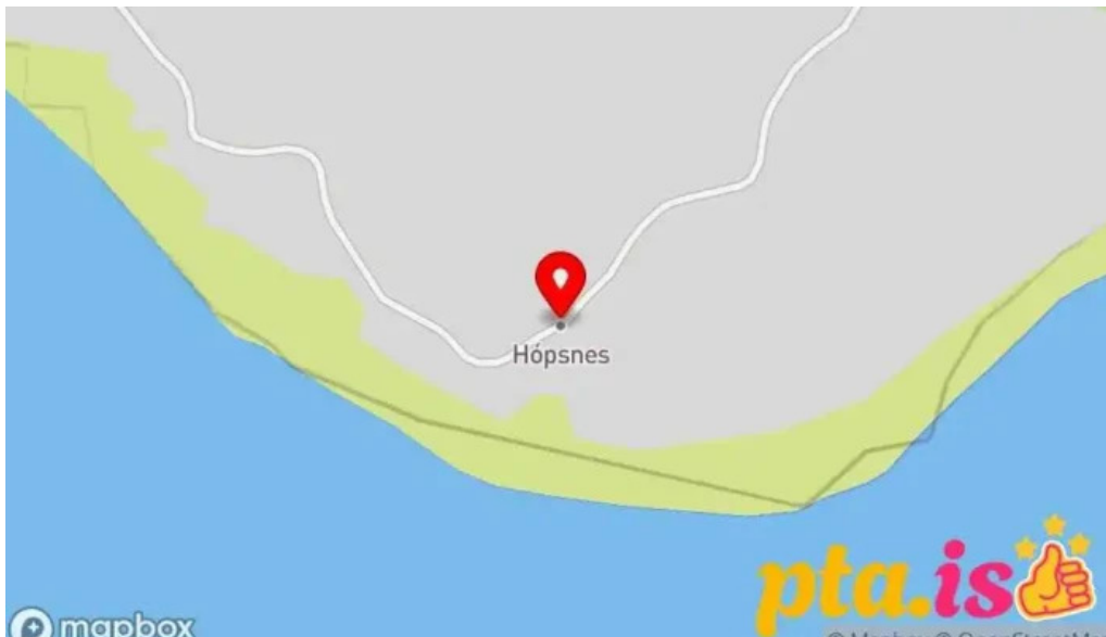
Hopsnes lighthouse Kort