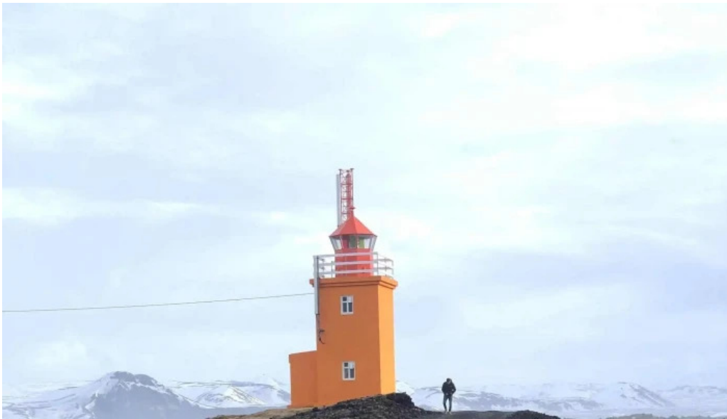
Hopsnes lighthouse grindavik