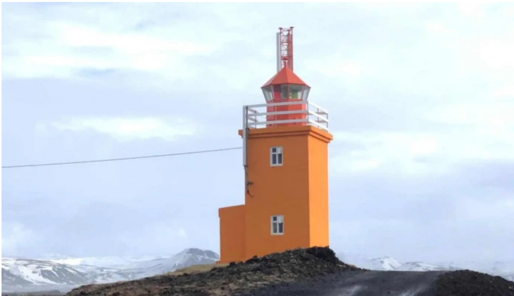
Hopsnes lighthouse afslættir