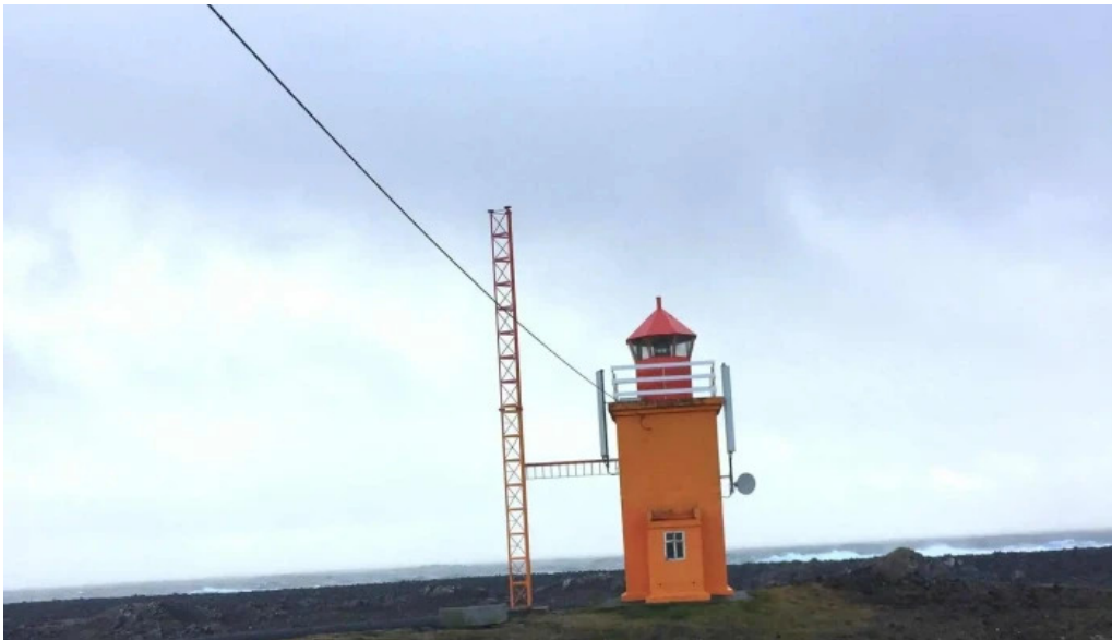
Hopsnes lighthouse instagram