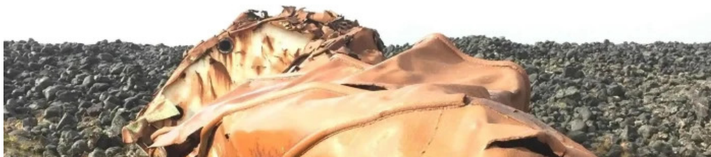
Hopsnes lighthouse svæði