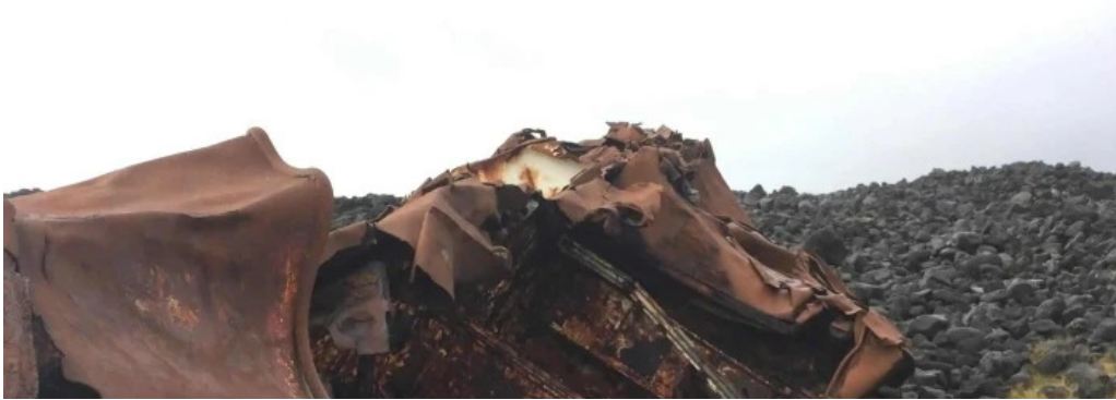
Hopsnes lighthouse heimilisfang