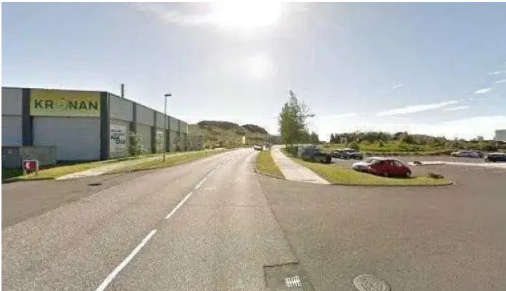
Subway street view 360deg