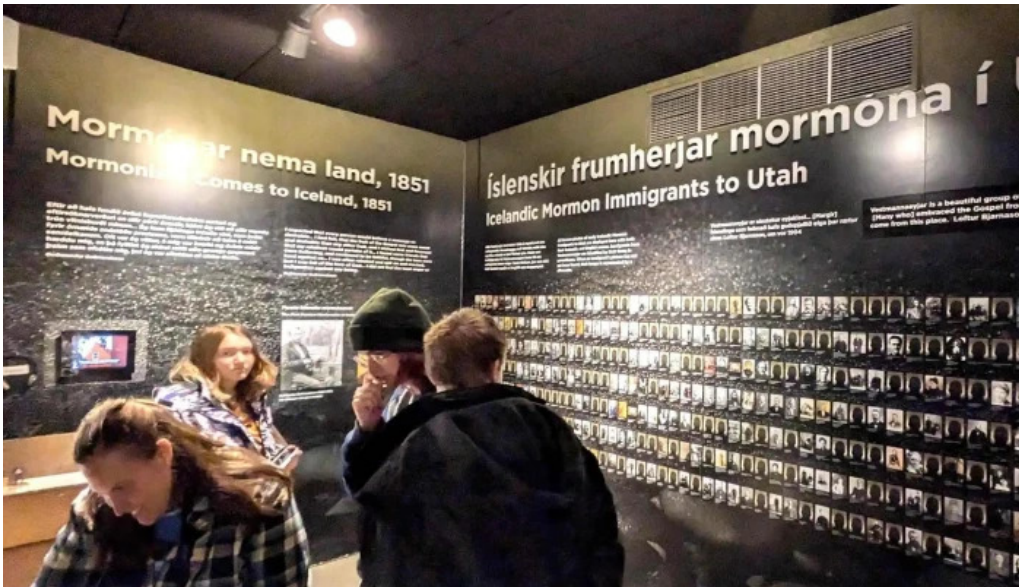
Sagnheimar opið nuna