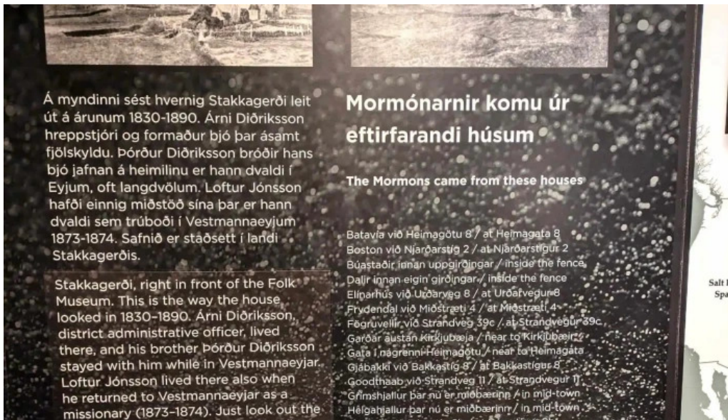
Sagnheimar hvernig a að komast þangað