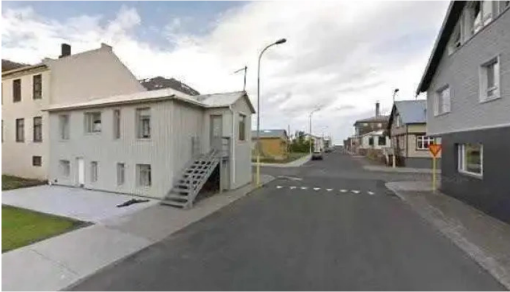
Thjodlagasetur street view 360deg