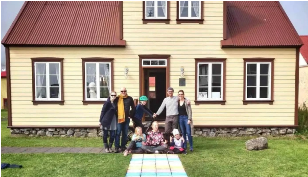
Thjodlagasetur fra eiganda