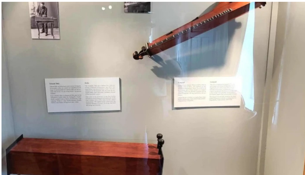
Thjodlagasetur nalægt mer