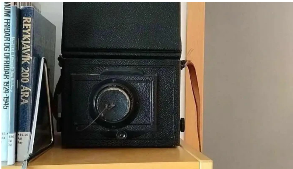
Ljosmyndasafn reykjavíkur myndskeld