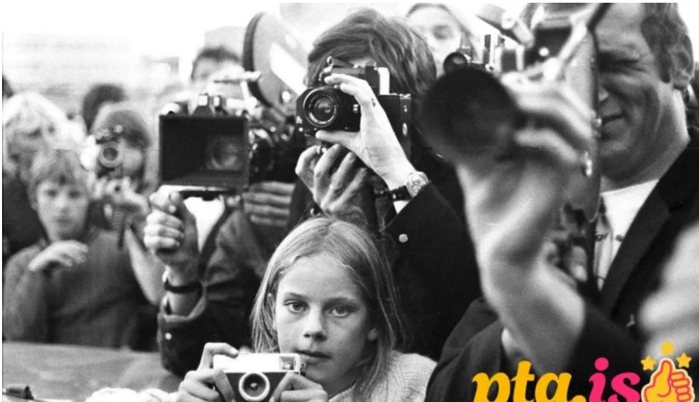
Ljosmyndasafn reykjavíkur reykjavík