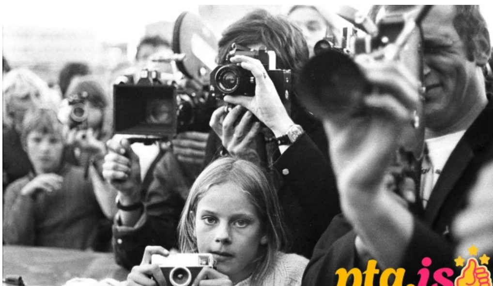
Ljosmyndasafn reykjavíkur safn