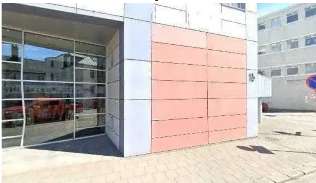
Ljosmyndasafn reykjavíkur street view 360