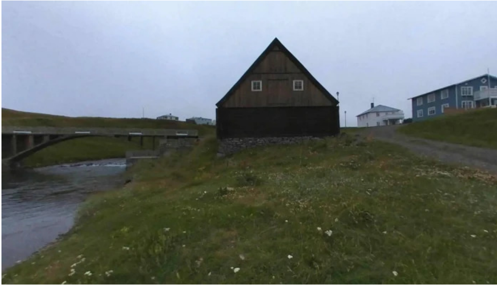
Vesturfararsetrid street view 360deg