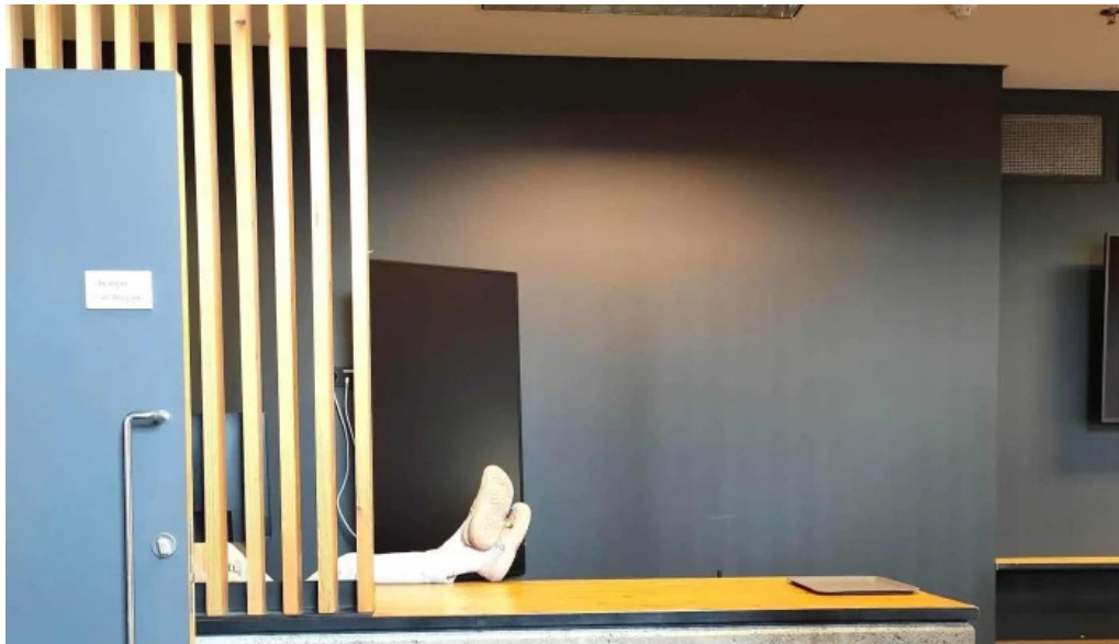
Kvikan saltfisksetur islands og upplýsingamidstod ferdamanna simi