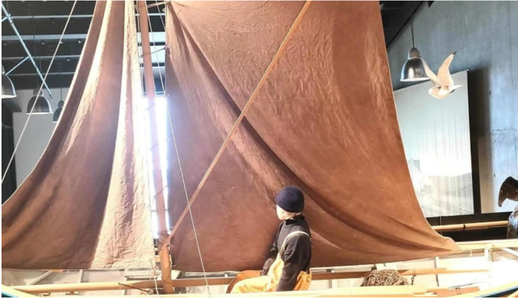
Kvikan saltfisksetur islands og upplýsingamidstod ferdamanna hvernig a að komast þangað