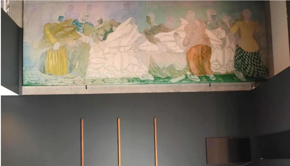
Kvikan saltfisksetur islands og upplýsingamidstod ferdamanna svæði