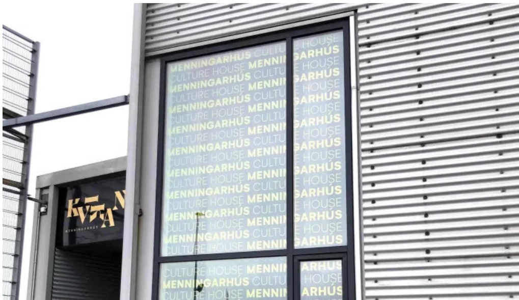
Kvikan saltfisksetur islands og upplýsingamidstod ferdamanna myndir