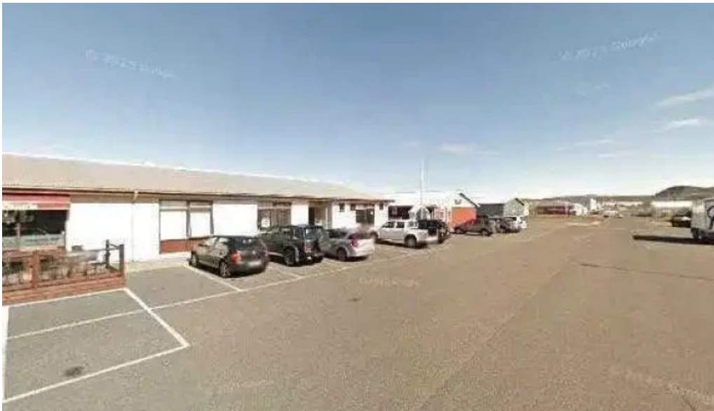
Kvikan saltfisksetur islands og upplýsingamidstod ferdamanna street view 360deg