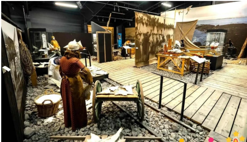
Kvikan saltfisksetur islands og upplýsingamidstod ferdamanna safn