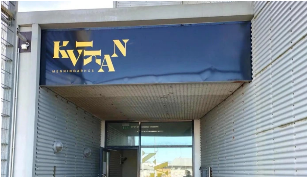
Kvikan saltfisksetur islands og upplýsingamidstod ferdamanna grindavik