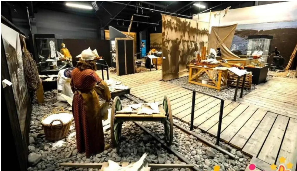
Kvikan saltfisksetur íslands og upplýsingamiðstöð ferðamanna grindavík