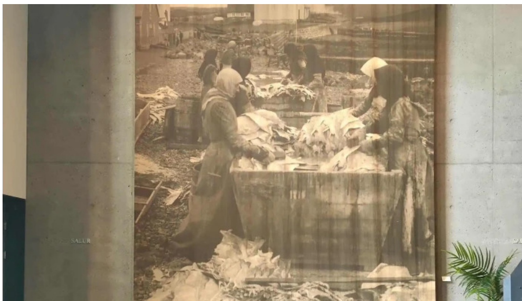
Kvikan saltfisksetur islands og upplýsingamidstod ferðamanna athugasemdir