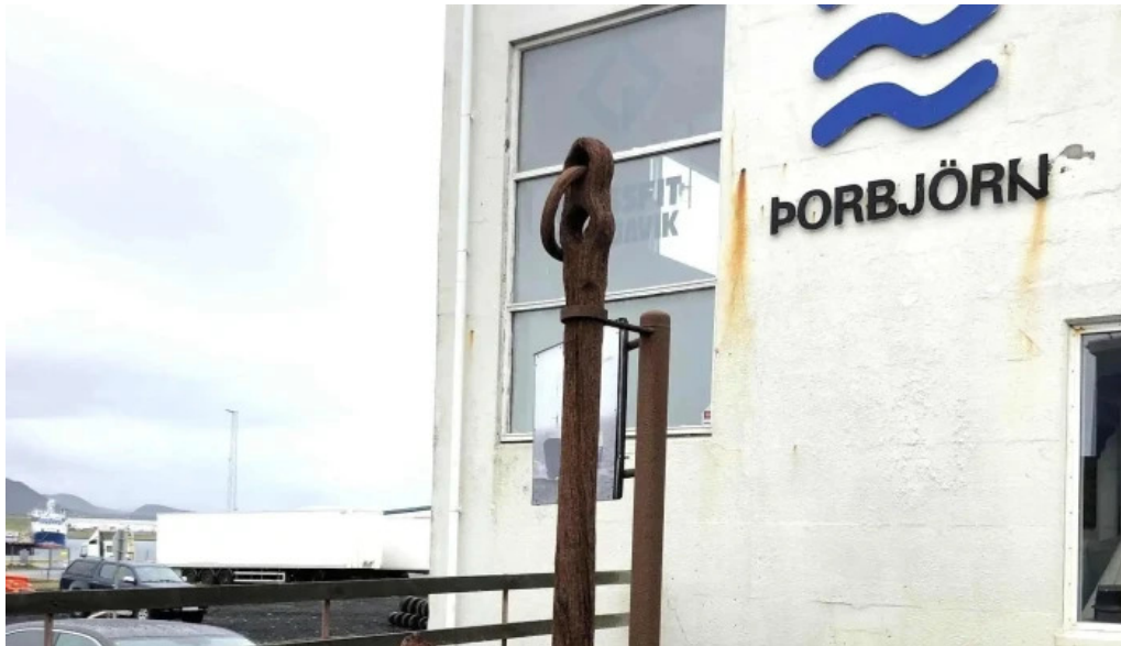
Kvikan saltfisksetur islands og upplýsingamidstod ferdamanna nálægt mer