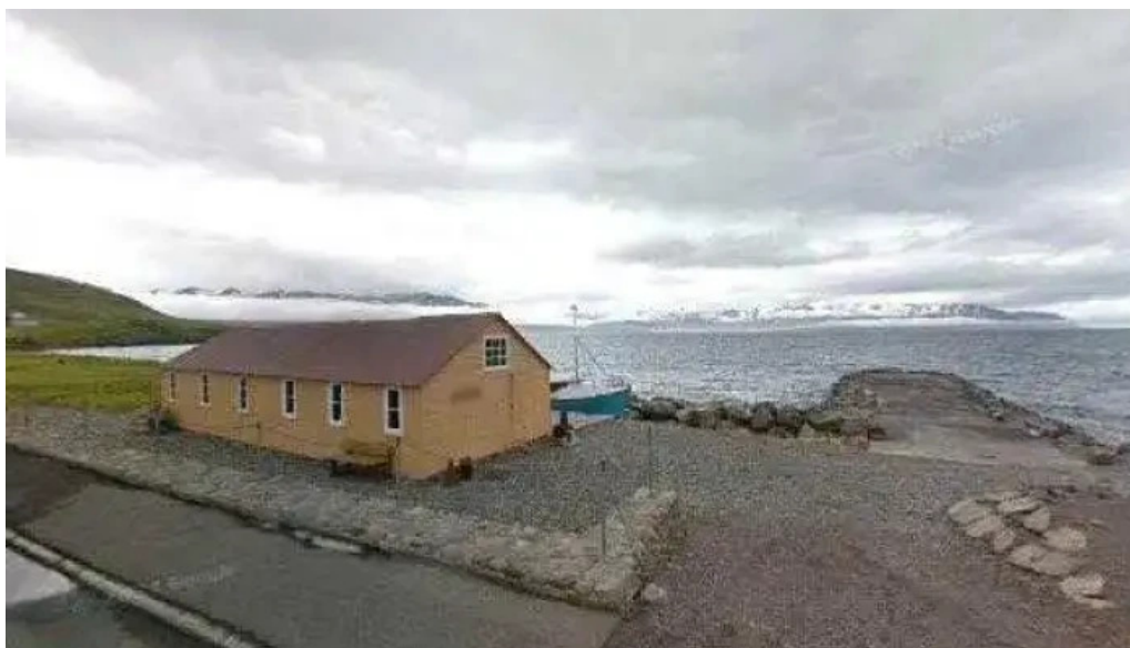
Utgerðaminjasafnið a grenivik safn