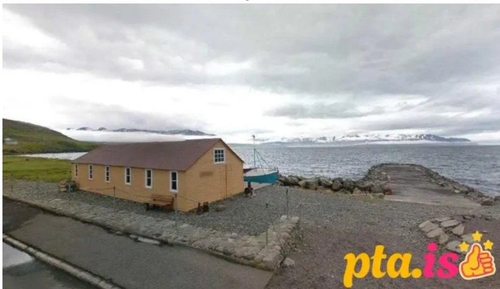
Utgerðaminjasafnið a grenivik grenivik