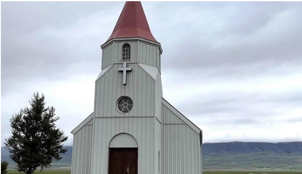
Glaumbaer safn safn