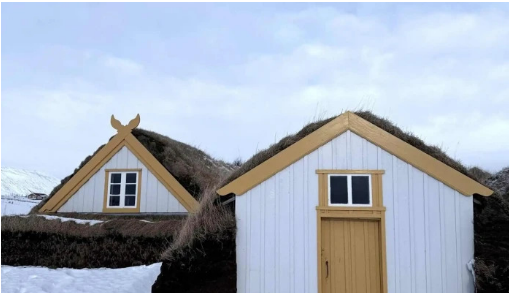
Glaumbaer safn kynning