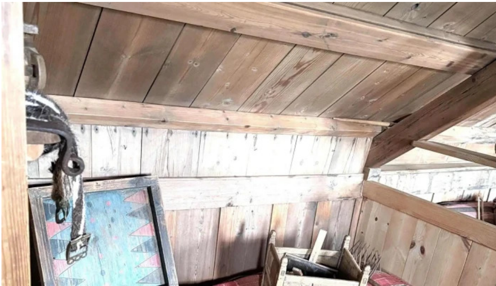
Glaumbaer safn einkunn