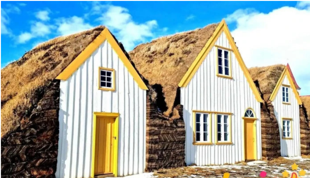
Glaumbær safn glaumbær