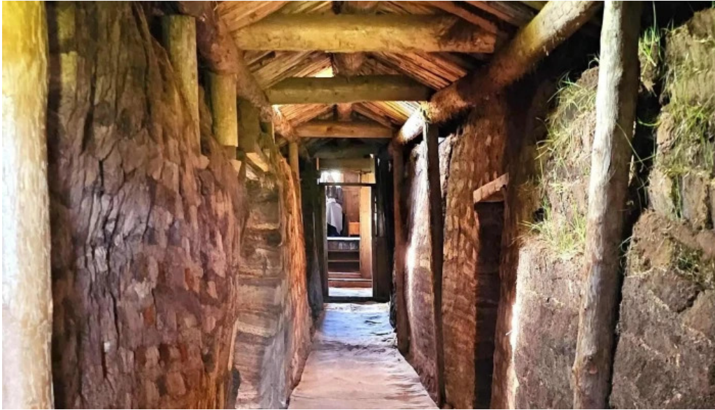
Glaumbaer safn glaumbær