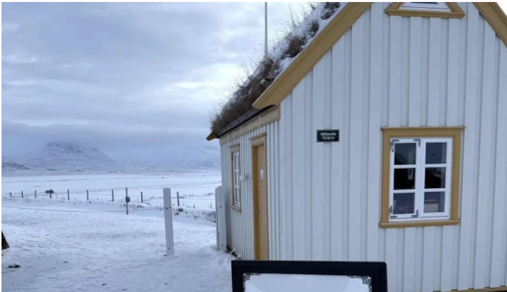
Glaumbaer safn heimilisfang