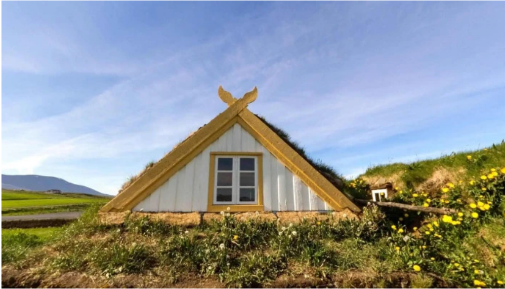
Glaumbaer safn street view 360deg