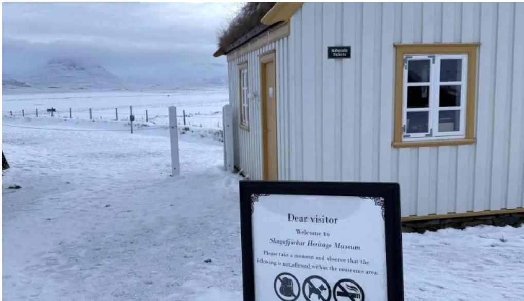
Glaumbaer safn nýjast