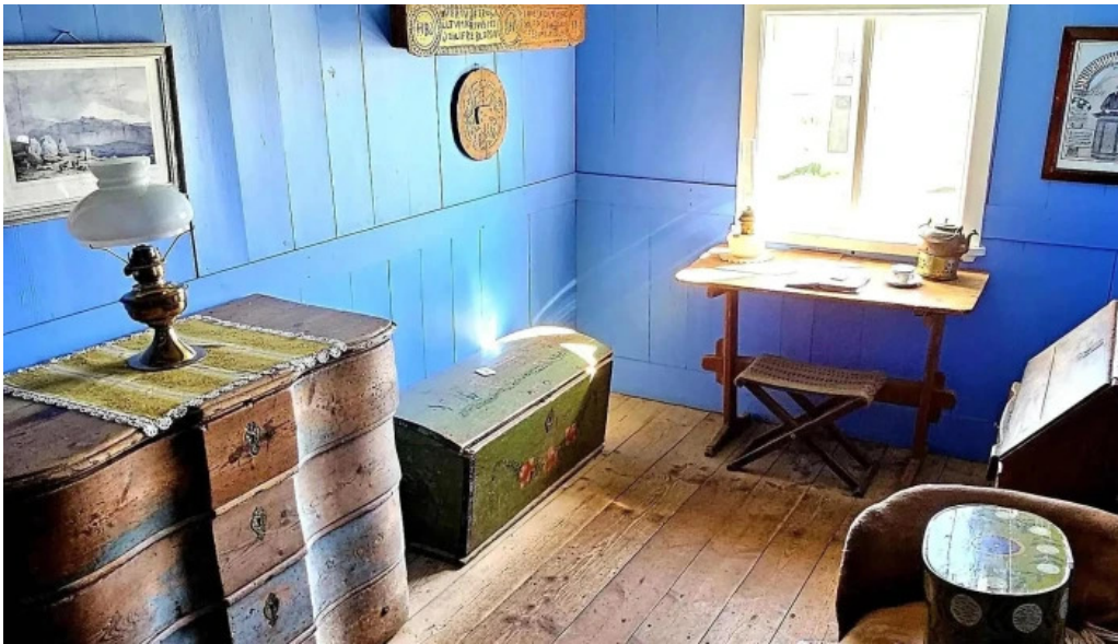
Glaumbaer safn afslættir