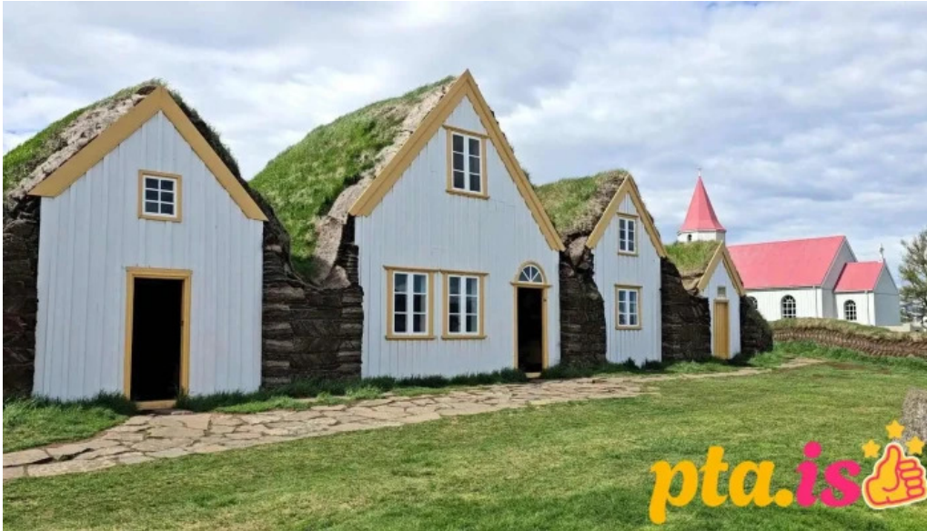
Glaumbaer safn myndskeld