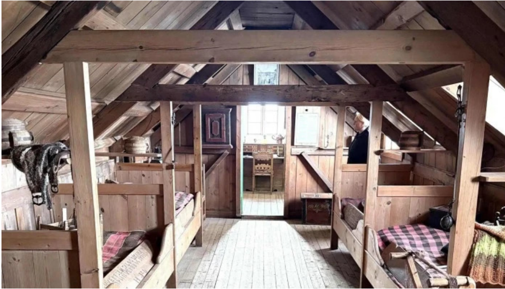
Glaumbaer safn ætlun