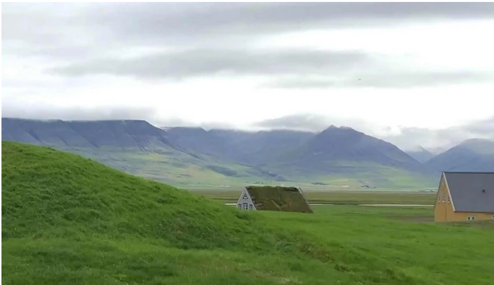
Glaumbaer safn instagram