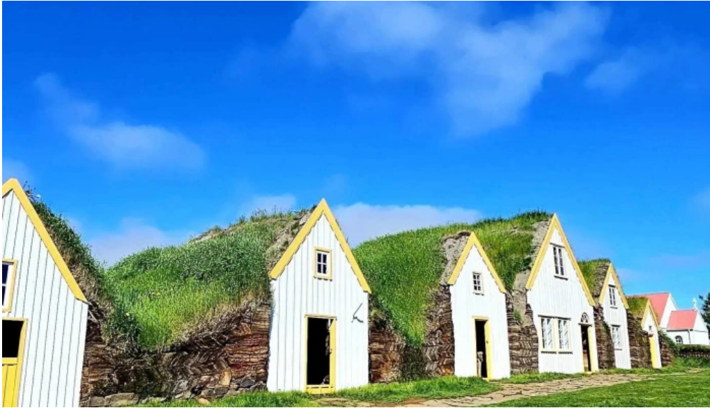
Glaumbaer safn opið nuna