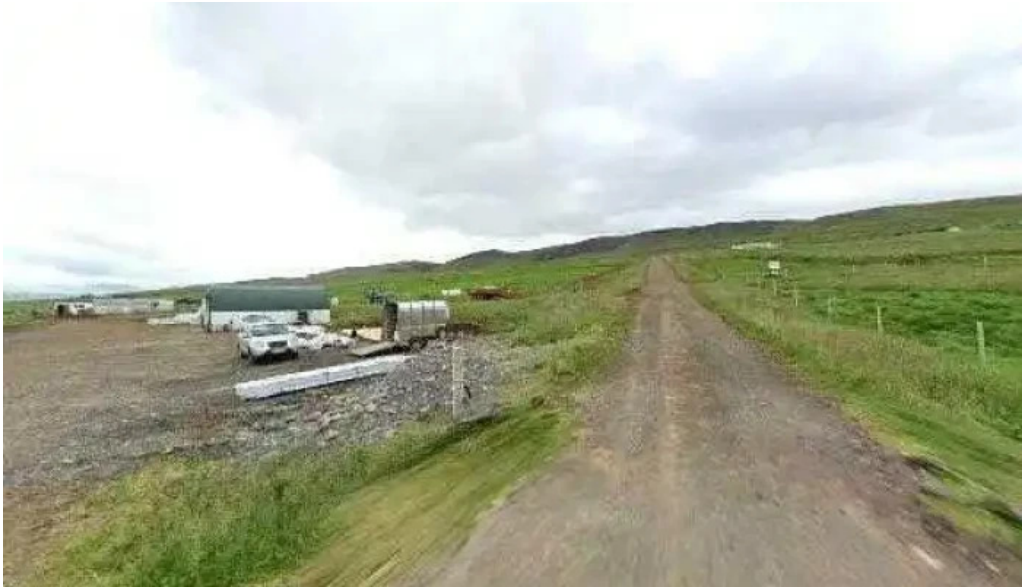
Lytingsstadir street view 360deg