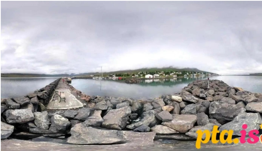
Fjarðabyggð skrifstofa reyðarfjorður