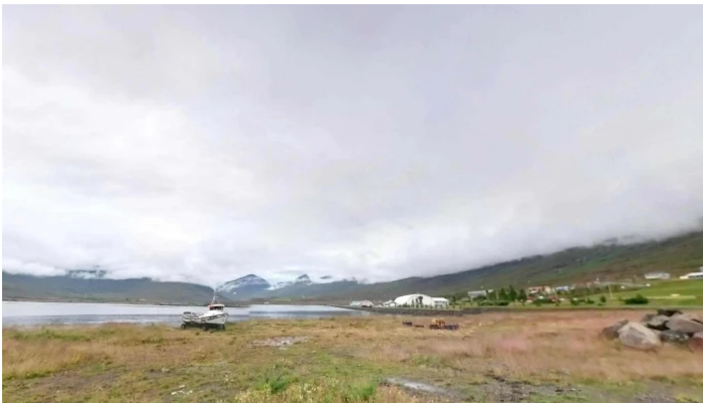
Fjardabyggd skrifstofa street view 360deg