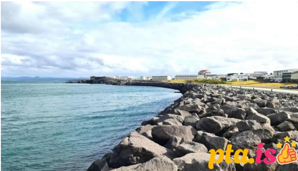
Reykjanesbaer raðhus eða bæjar sveitarstjornarskrifstofa