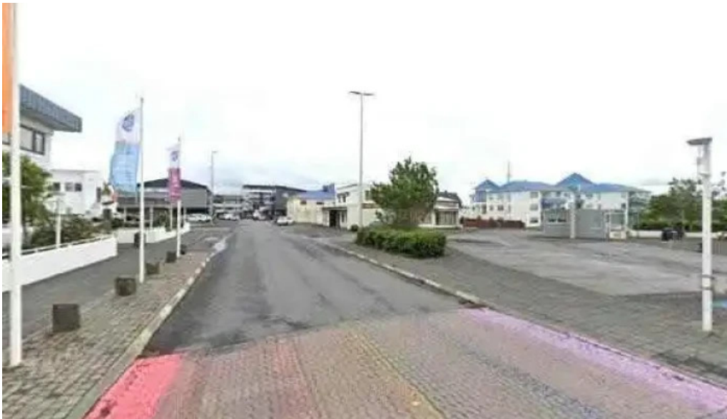
Reykjanesbær street view 360deg