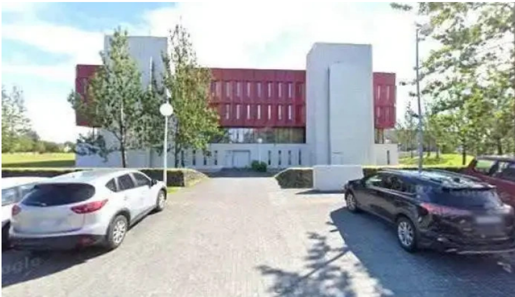
Issn landsmiðstöð íslands raðgjafi