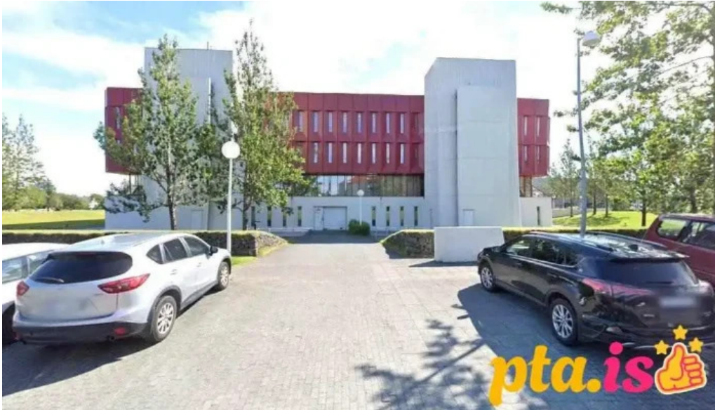
Issn landsmiðstoð íslands reykjavík