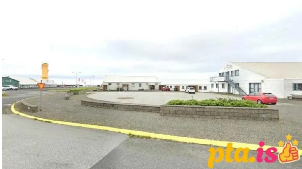
Naturustofa suðvesturlands southwest iceland nature research centre sandgerði