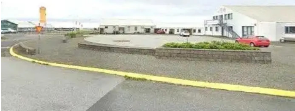
Natturustofa sudvesturlands southwest iceland nature research centre rannsoknarstofnun