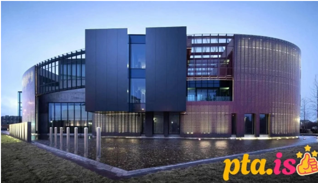
Stofnun arna magnussonar i islenskum fræðum reykjavik