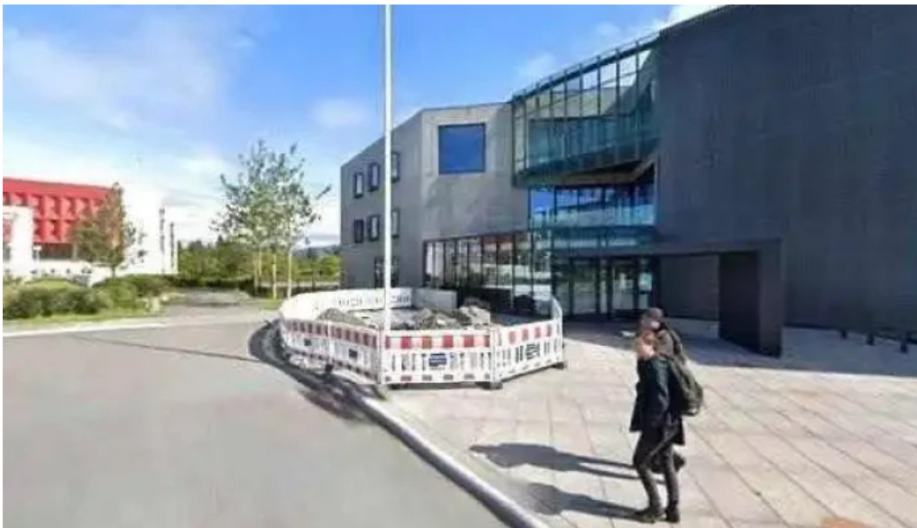
Stofnun arna magnussonar i islenskum fraedum street view 360deg