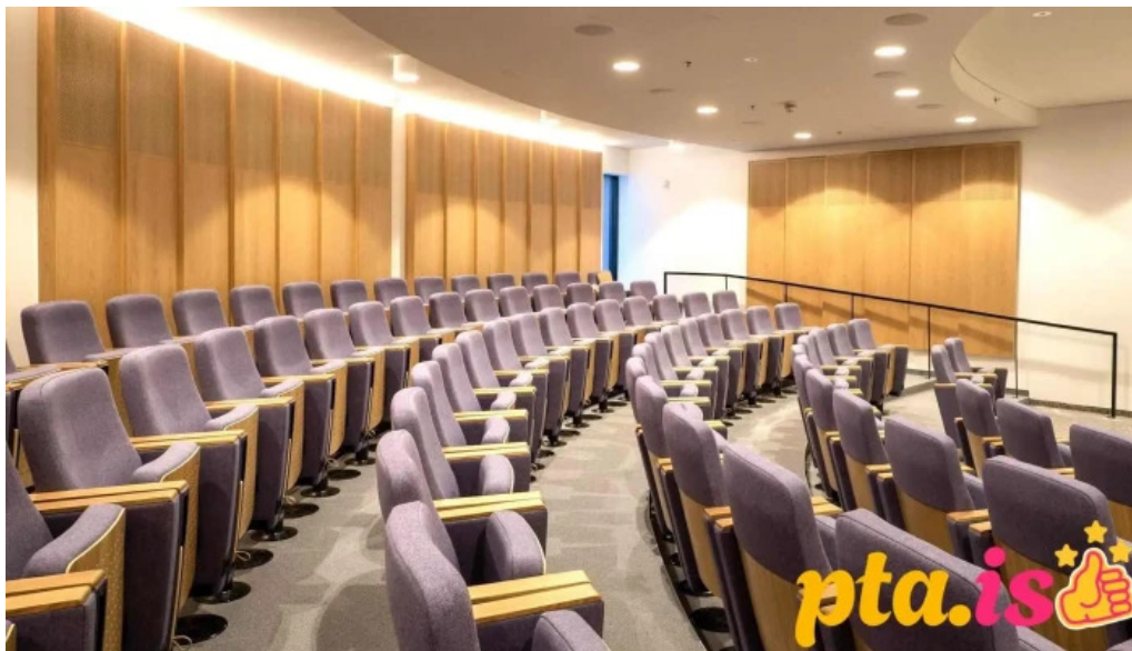
Stofnun arna magnússonar í íslenskum fræðum frá eiganda