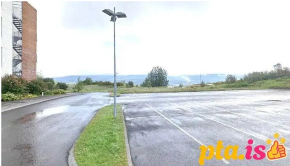
Naturufræðistofnun islands akureyri