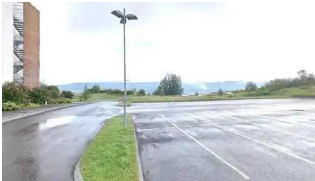
Naturufraedistofnun islands rannsoknarstofnun