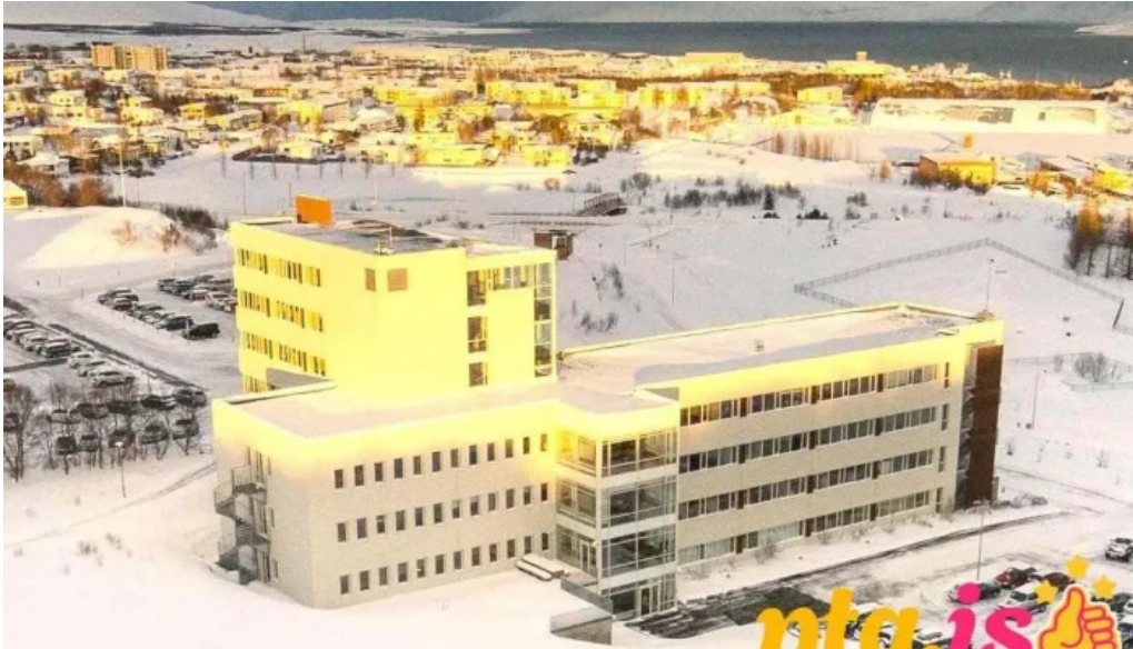
Naturufraedistofnun islands fra eiganda