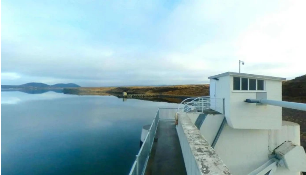
Steingrimsstod street view 360deg