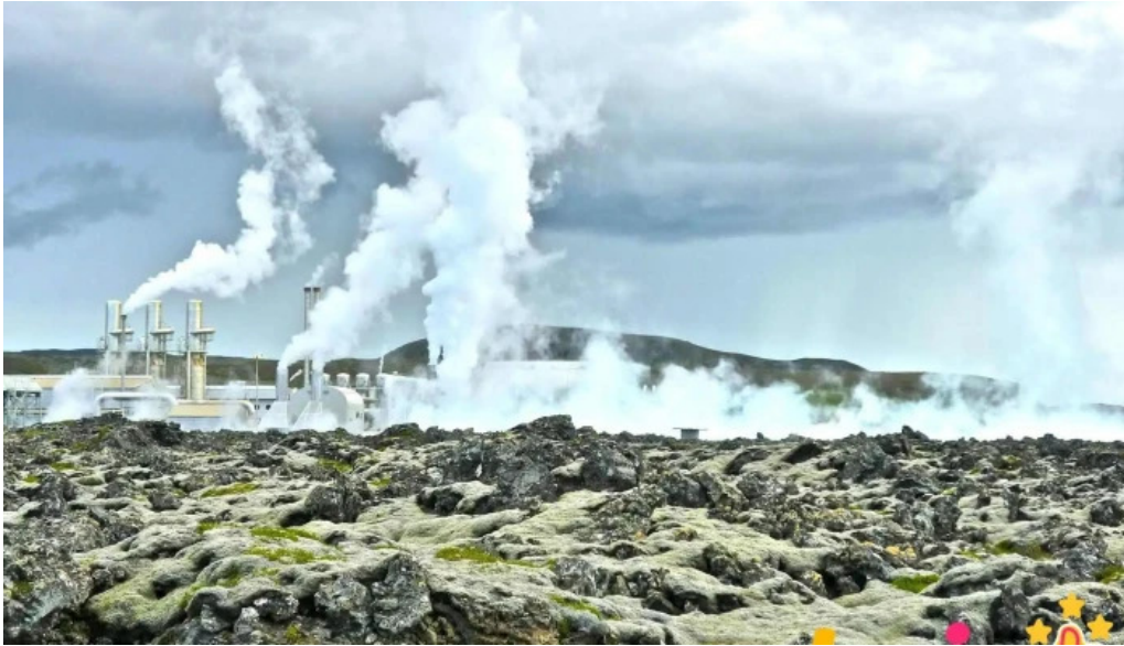
Orkuver i svartsengi raforkuver