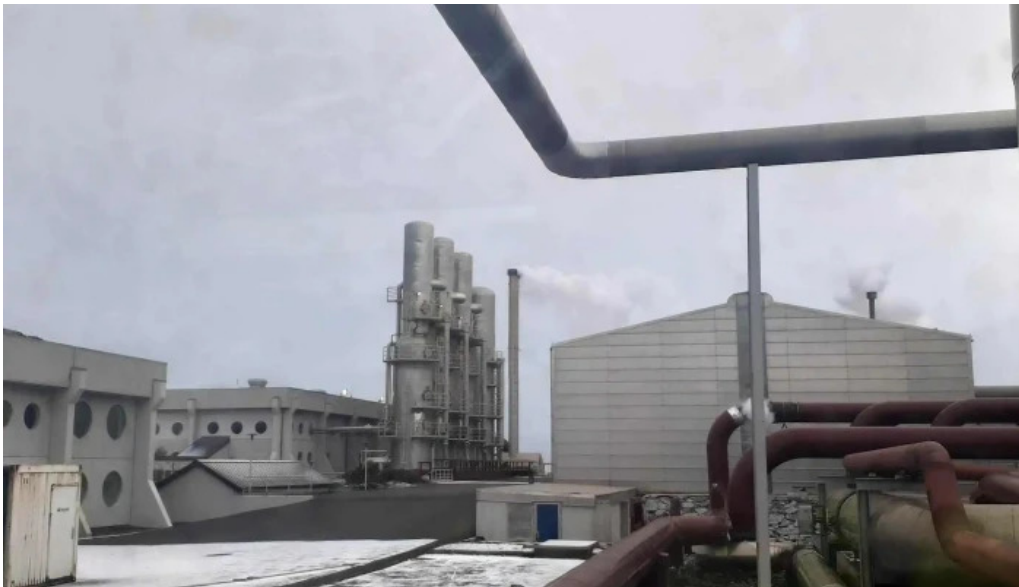
Orkuver i svartsengi afslættir