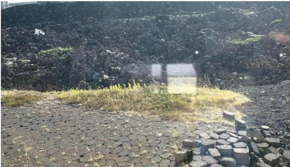
Orkuver i svartsengi nálægt mer