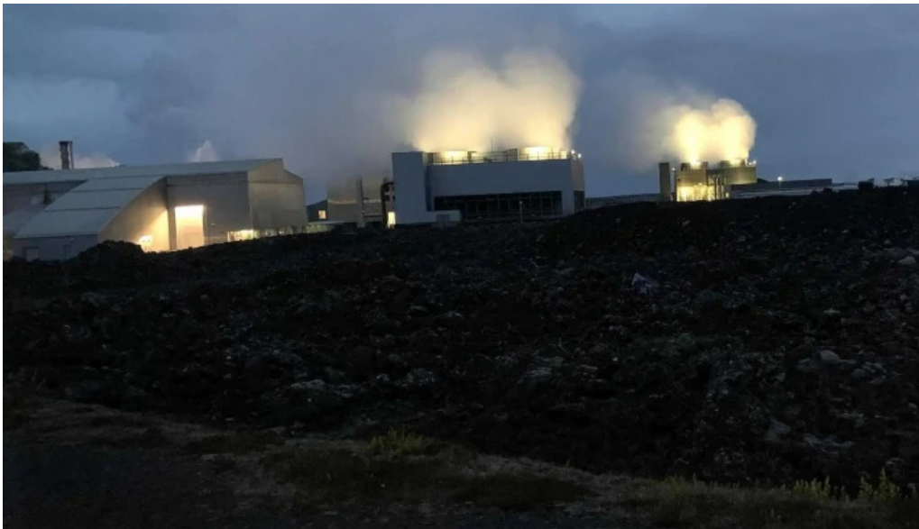
Orkuver i svartsengi grindavik