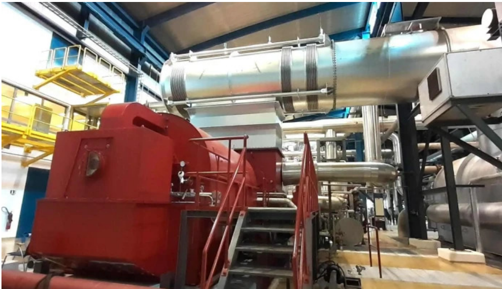
Orkuver i svartsengi einkunn