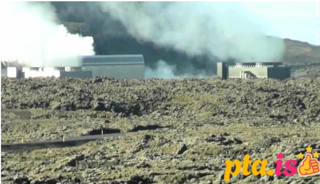
Orkuver i svartsengi myndskleid