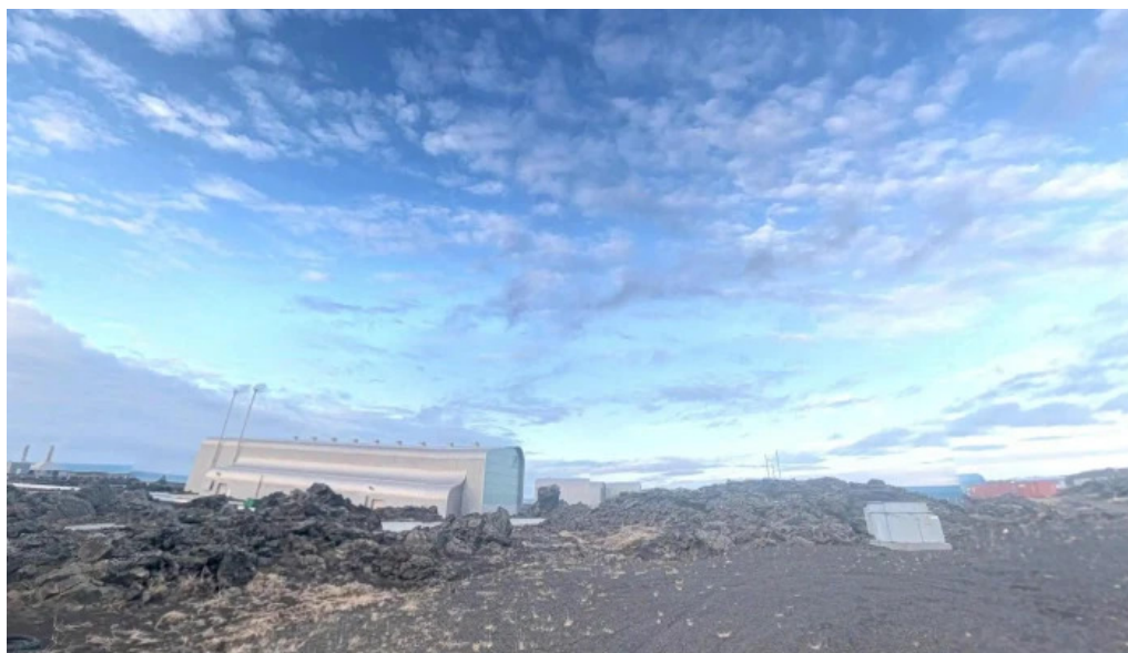
Orkuver i svartsengi street view 360deg