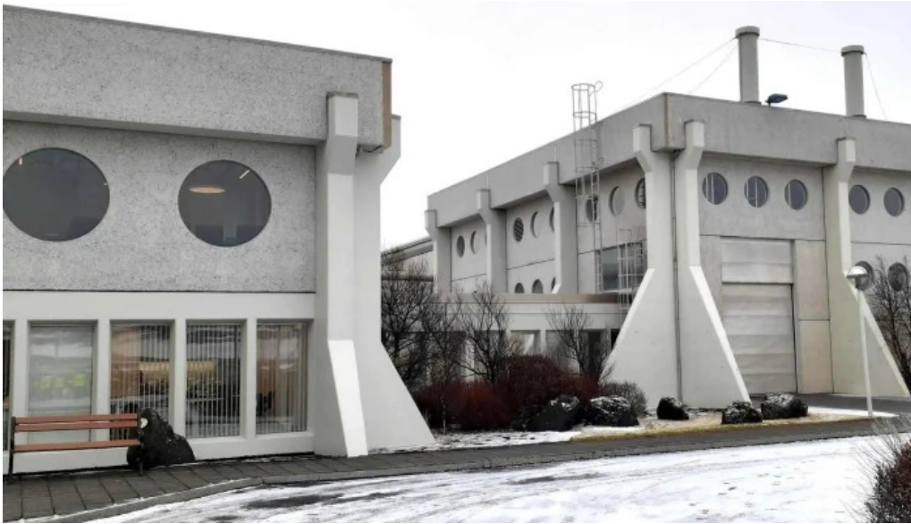
Orkuver i svartsengi heimilisfang