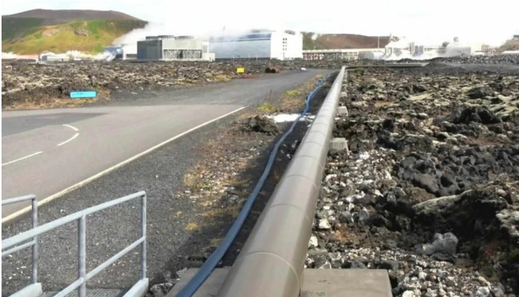
Orkuver i svartsengi staðsetning