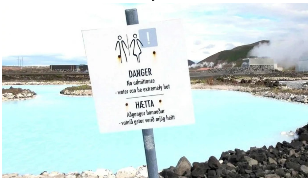
Orkuver i svartsengi svæði