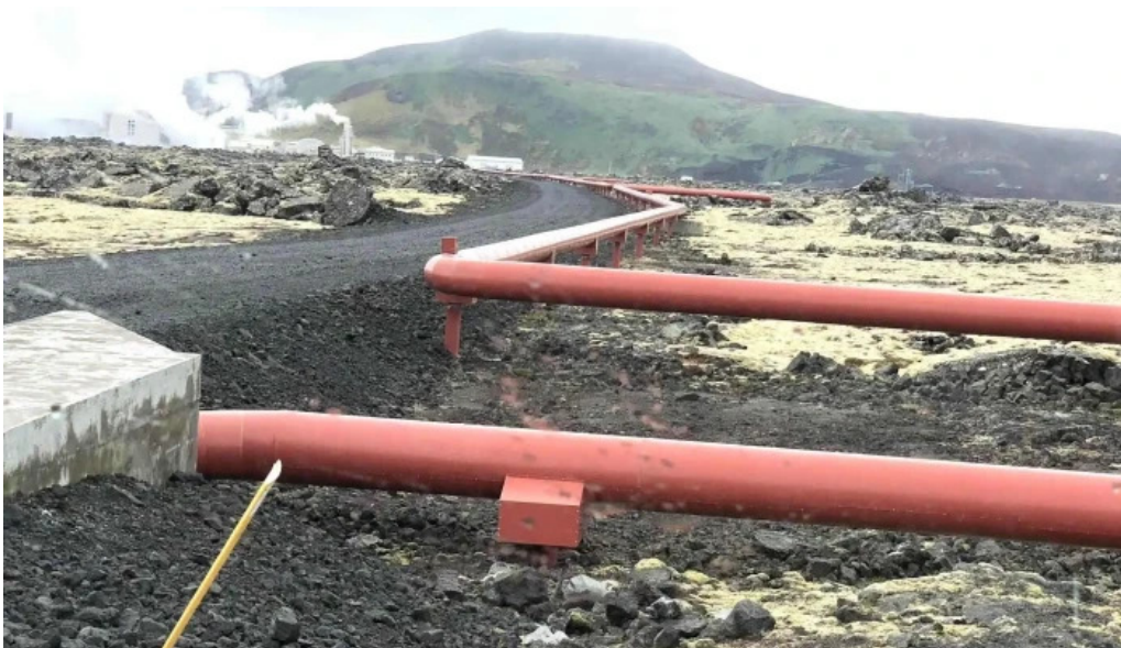
Orkuver i svartsengi instagram