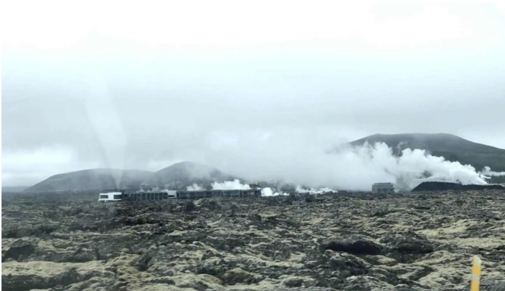
Orkuver i svartsengi safn