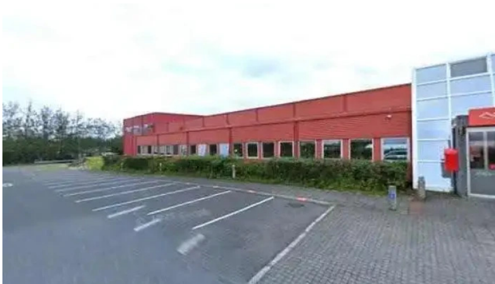
Íslandspostur postmiðstöð postþjónusta