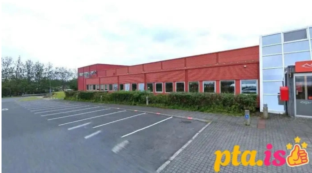
Íslandspostur postmiðstoð reykjavík