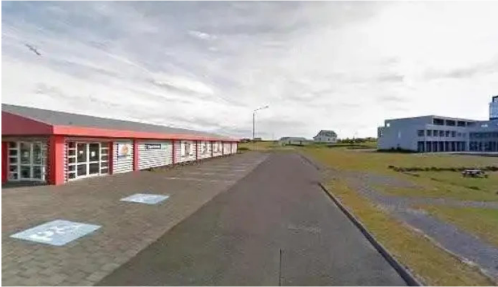
Postbox street view 360deg