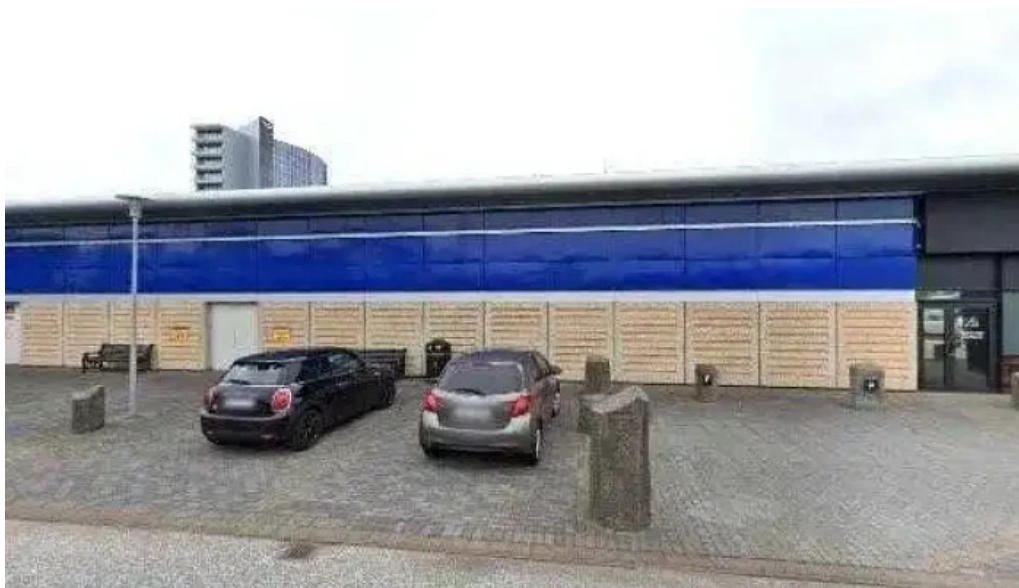
Postbox smaralind posthus