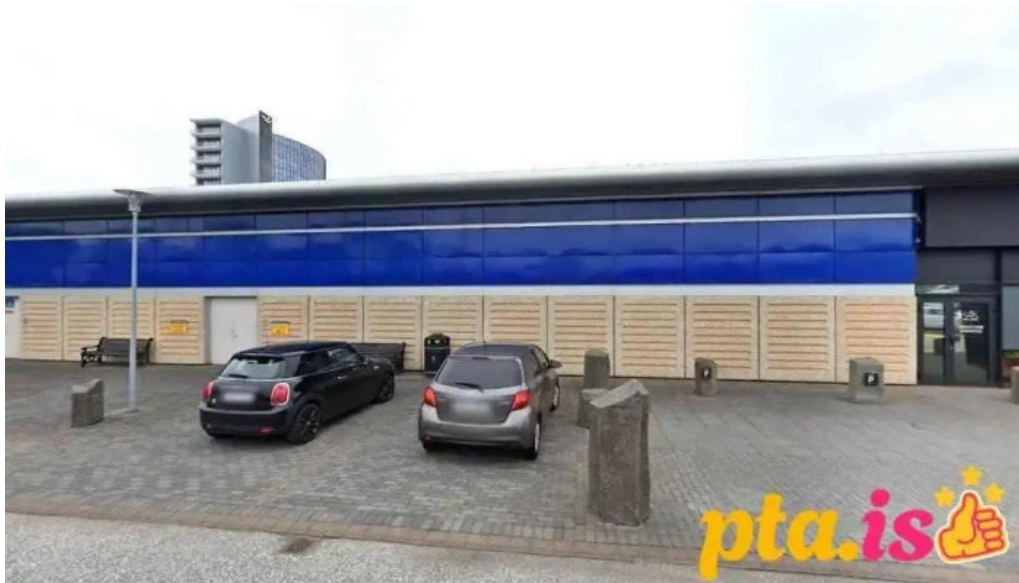
Postbox smaralind reykjavik