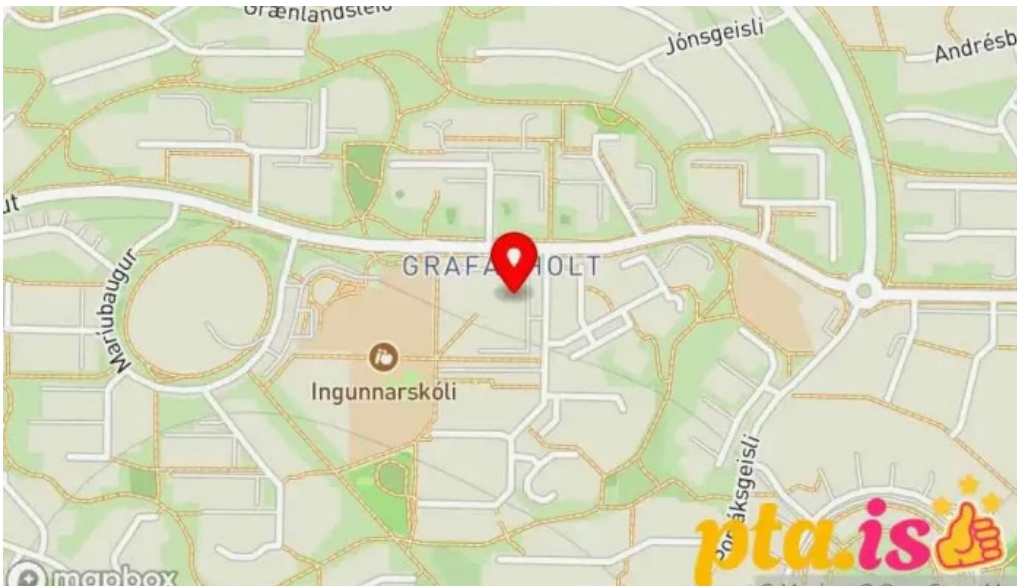
Postbox reykjavik grafarholti vid atlantsoliu Kort