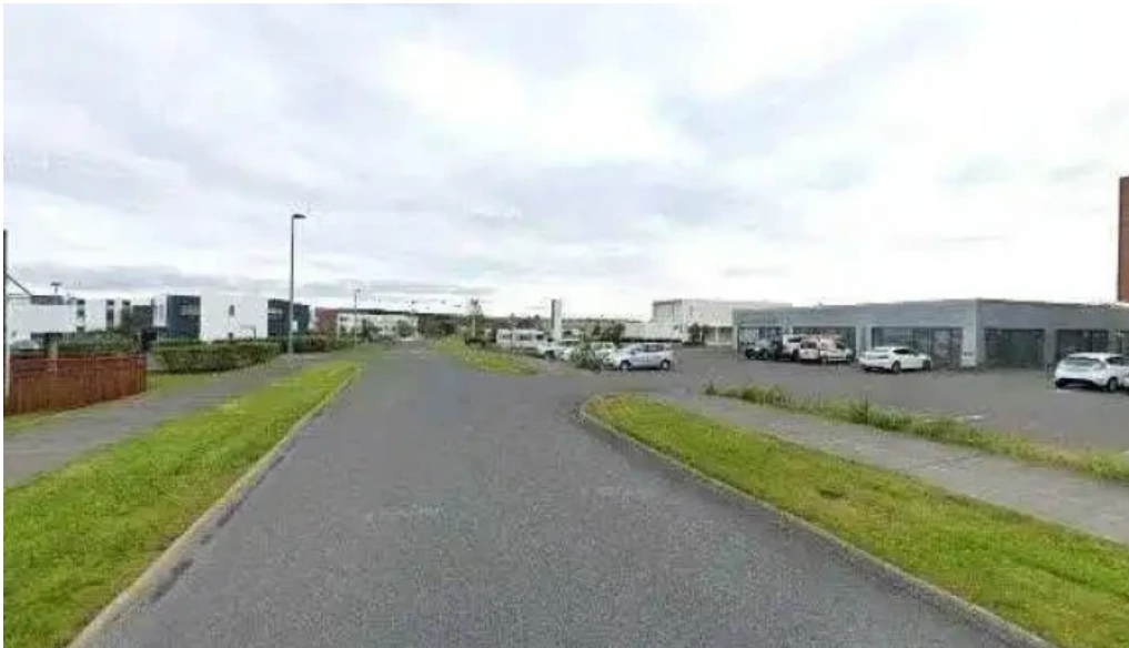
Postbox reykjavik grafarholti vid atlantsoliu street view 360deg