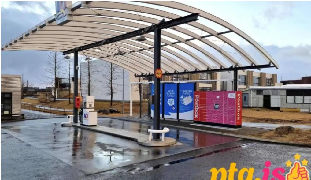
Postbox reykjavik grafarholti við atlantsoliu reykjavik