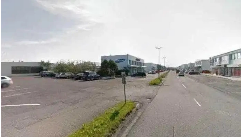
Islandspostur street view 360