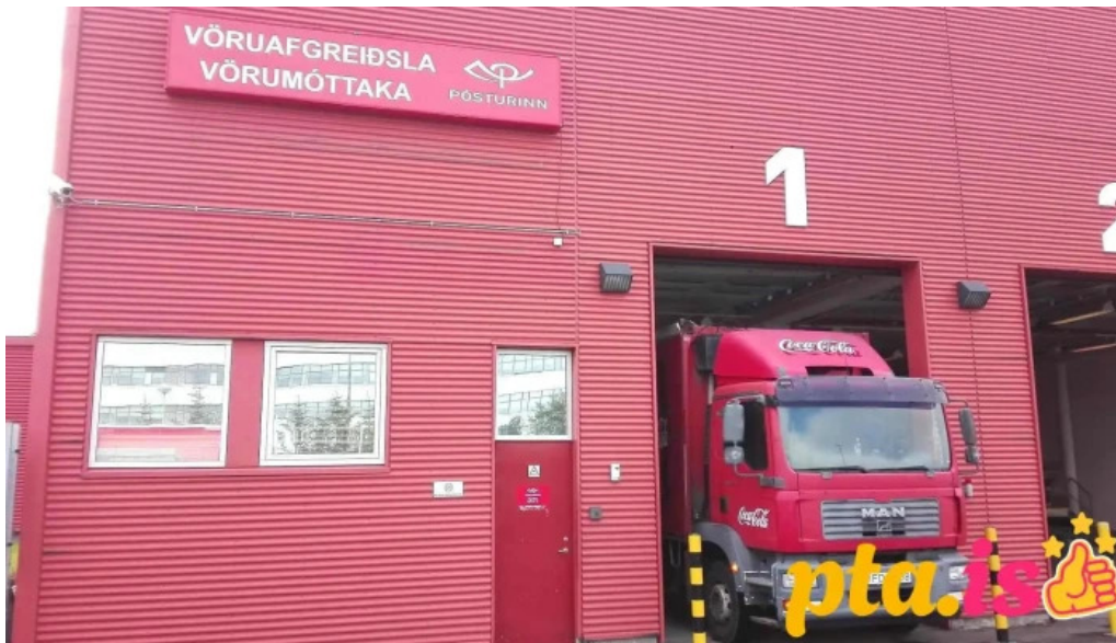
Fyrirtækjaposthus postsins posthus