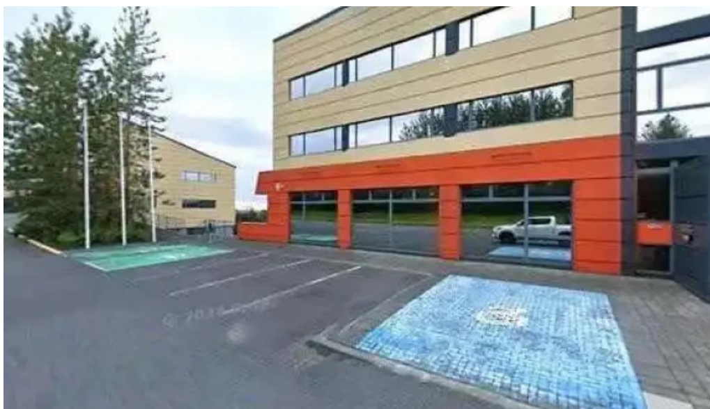
Fyrirtækjaposthus postsins street view 360