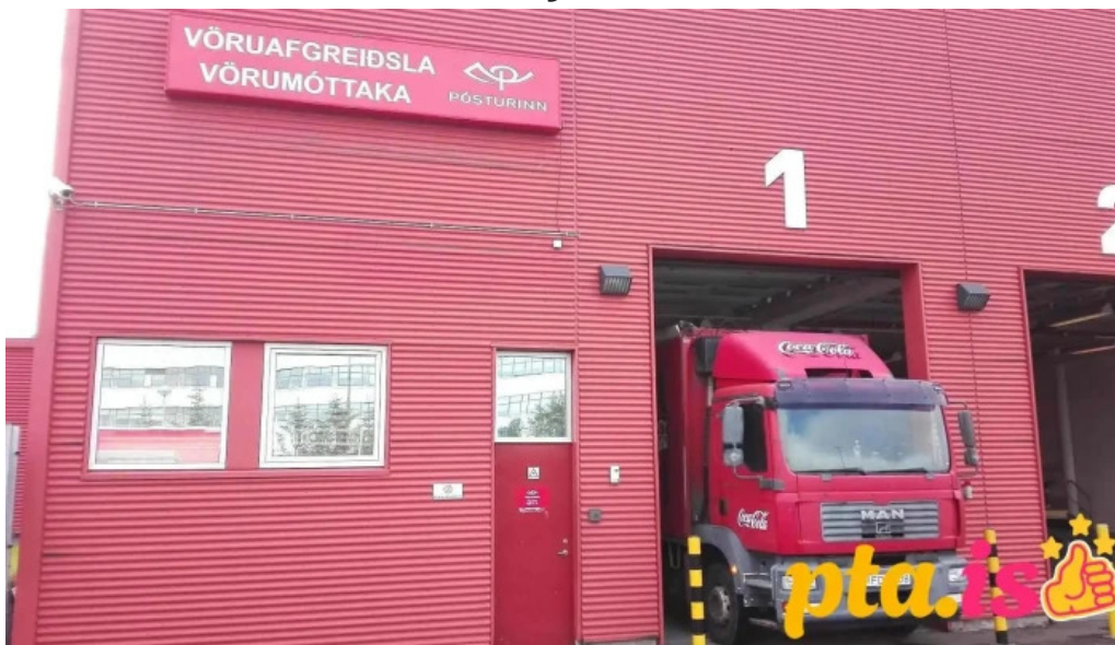
Fyrirtækjaposthus postsins reykjavik