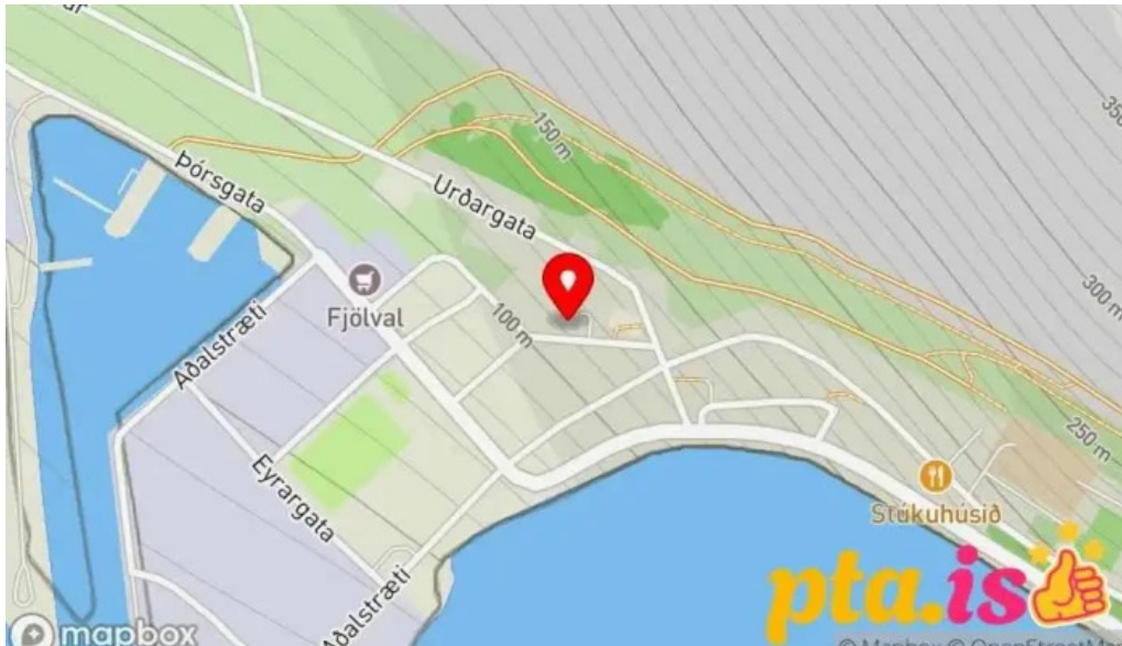
Posthusið a patreksfirði patreksfjörður