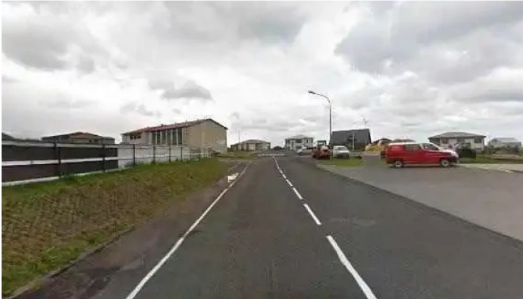
Posthusid a olafsvik street view 360deg