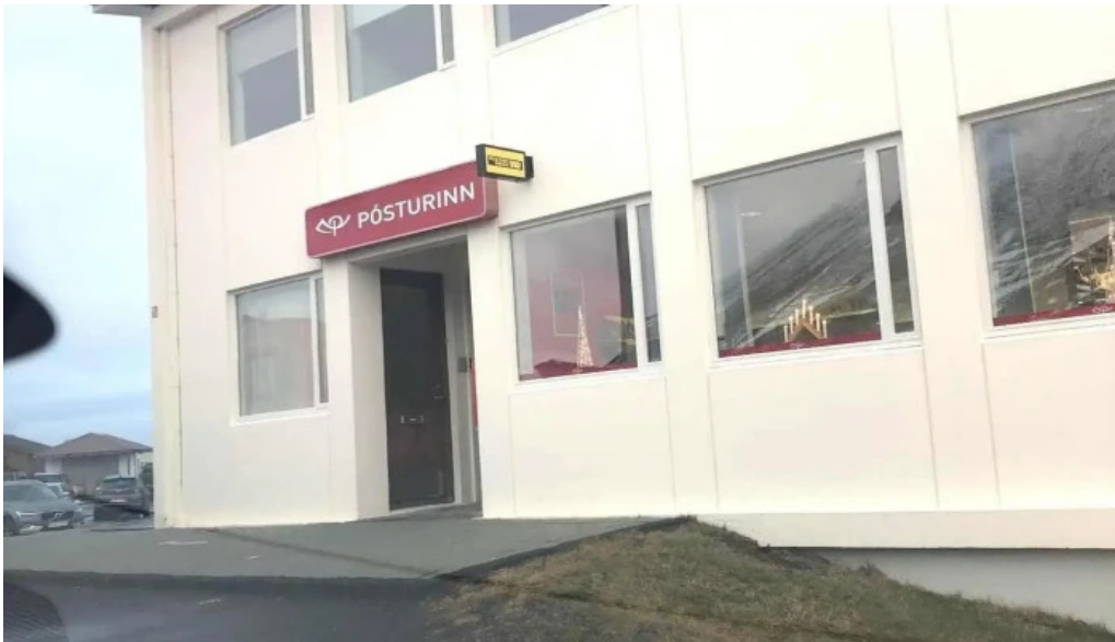
Posthusid a olafsvik posthus