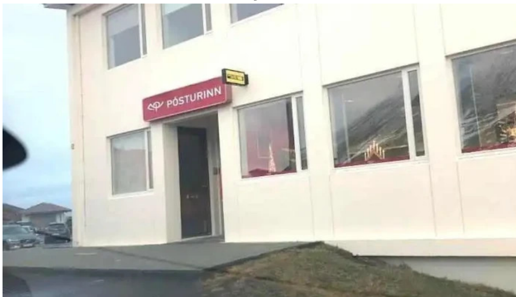
Posthusið a olafsvik olafsvik