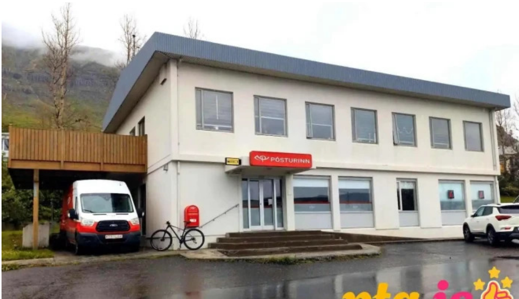
Posthus neskaupstaður neskaupstaður