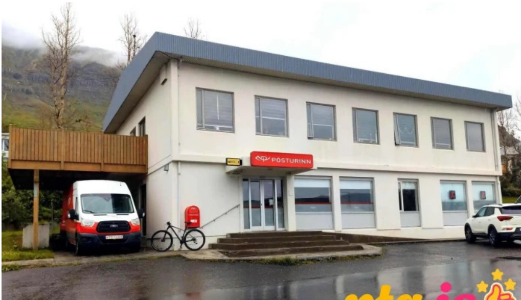
Posthus neskaupstadur posthus