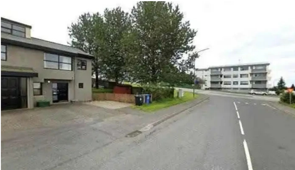
Postbox kopavogi graenatuni vid dotabudina street view 360deg