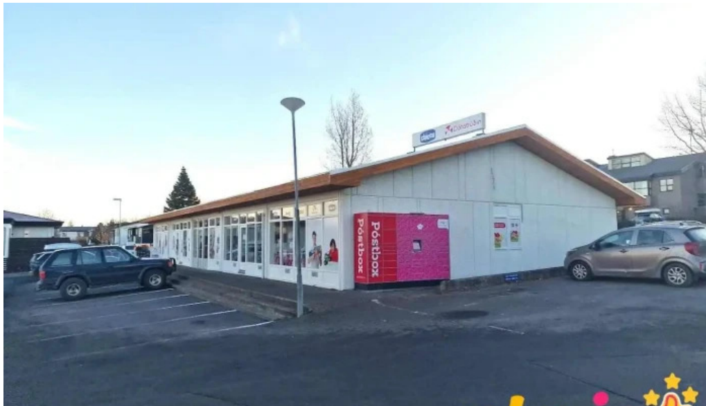
Postbox kópavogi grænatuni við dotabuðina kópavogur