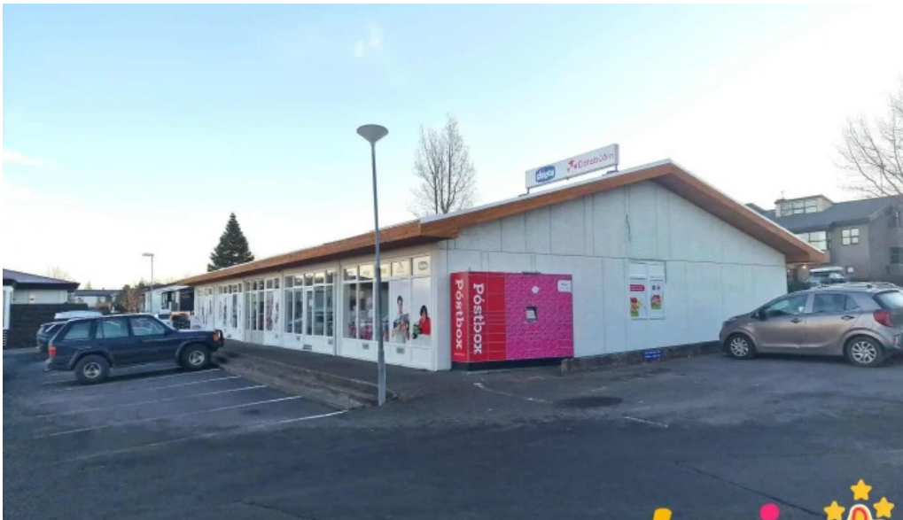
Postbox kopavogi graenatuni vid dotabudina posthus