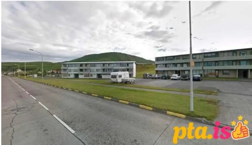
Postbox husavik við posthusið husavik