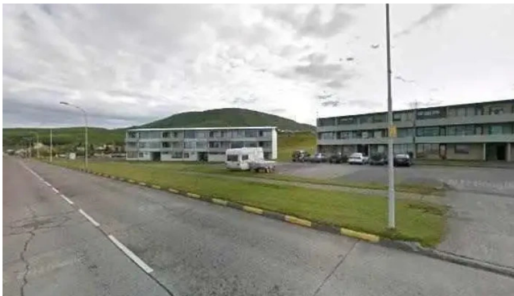
Postbox husavik vid posthusid posthus