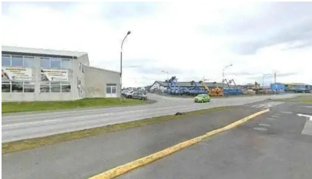
Postbox kaplakrika posthus