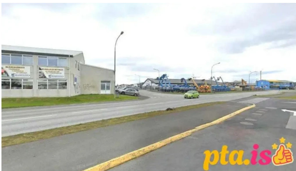
Postbox kaplakrika hafnarfjorður