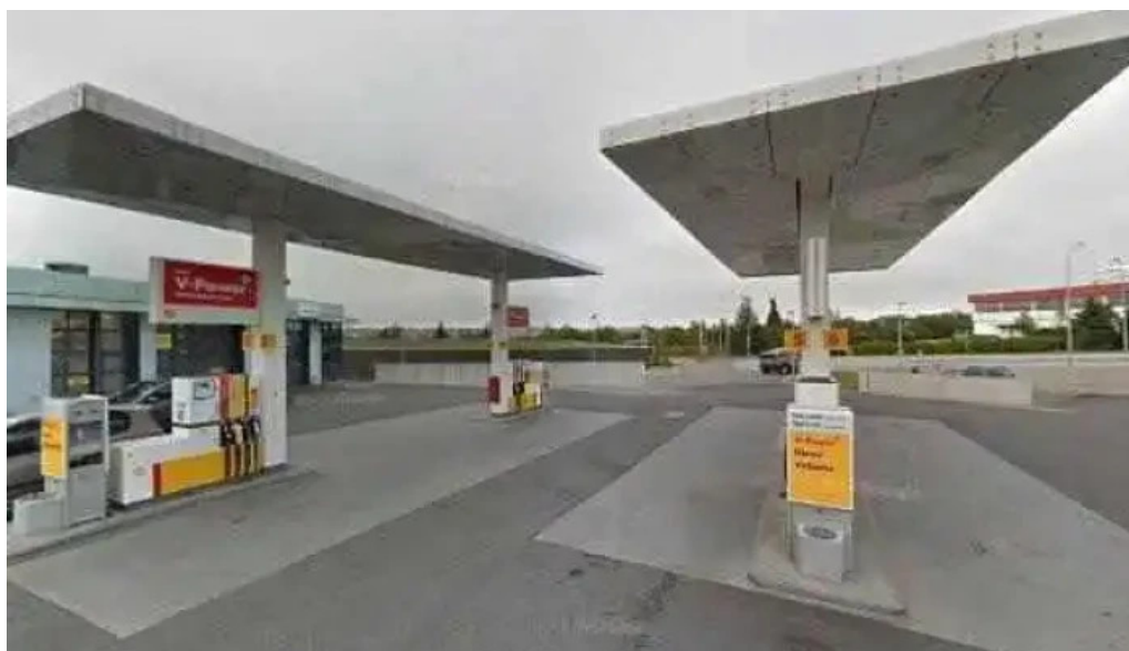
Postbox gardabae posthus