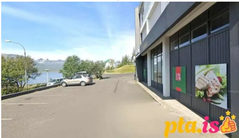
Postbox faskruðsfirði við kjörbúðina faskruðsfjorður