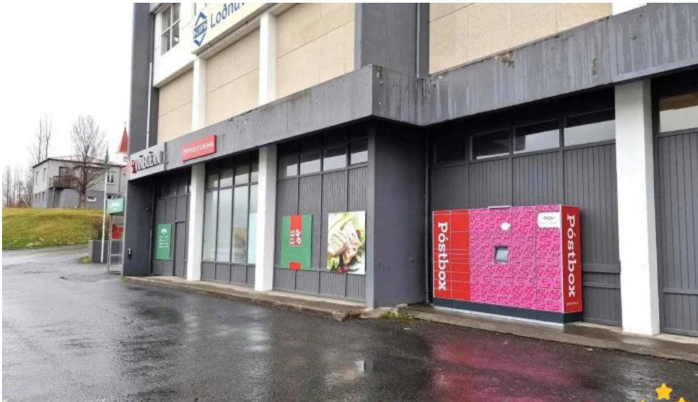
Postbox faskrudsfirdi vid kjorbudina fra eiganda