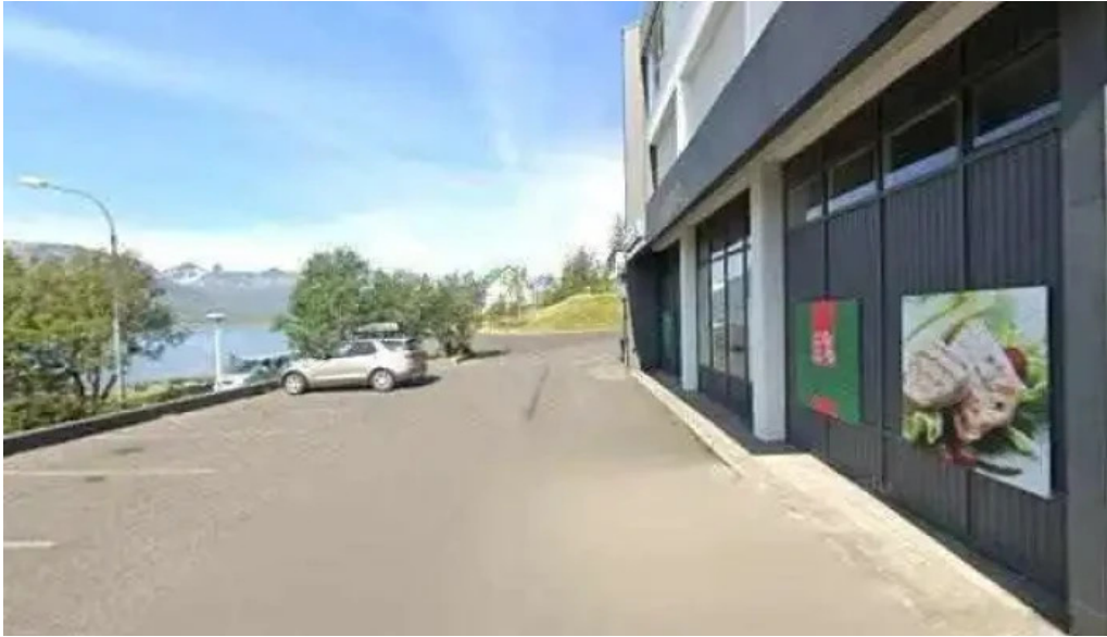
Postbox faskrudsfirdi vid kjorbudina posthus