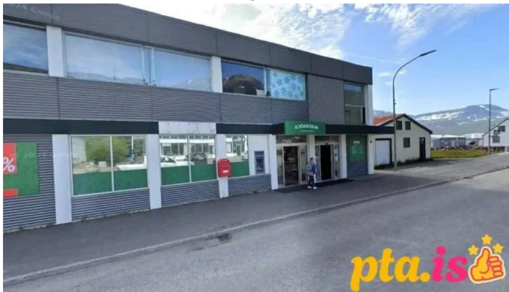
Postbox eskifirði við kjorbuðina eskifjorður