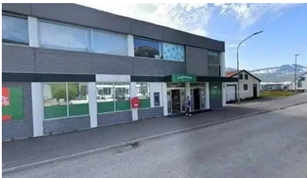
Postbox eskifirdi vid kjorbudina posthus