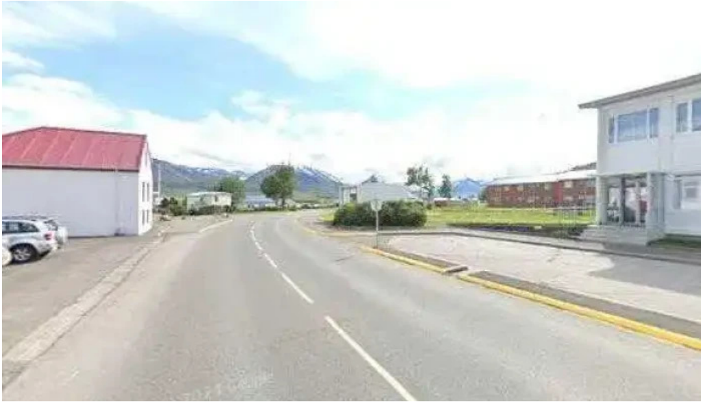
Posthus dalvik posthus