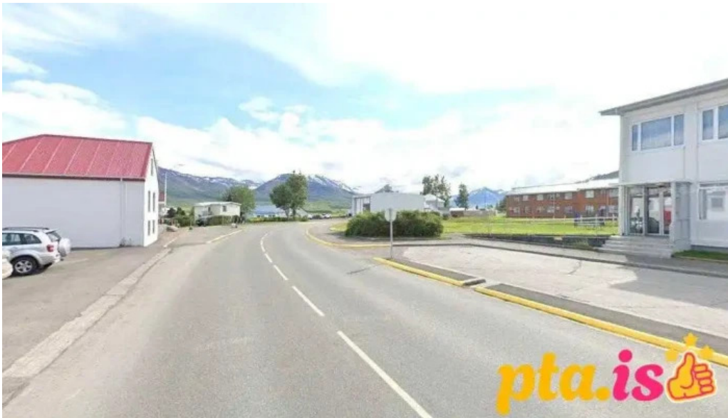
Posthus dalvik dalvik